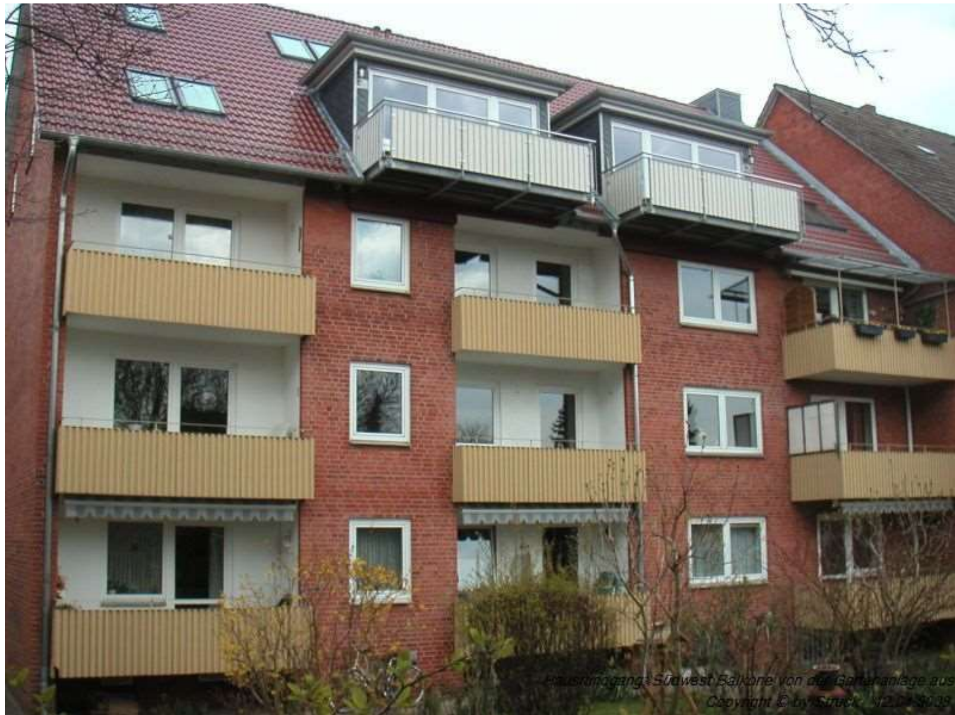
Hauszugang Südwest Balkone von der Gartenanlage aus