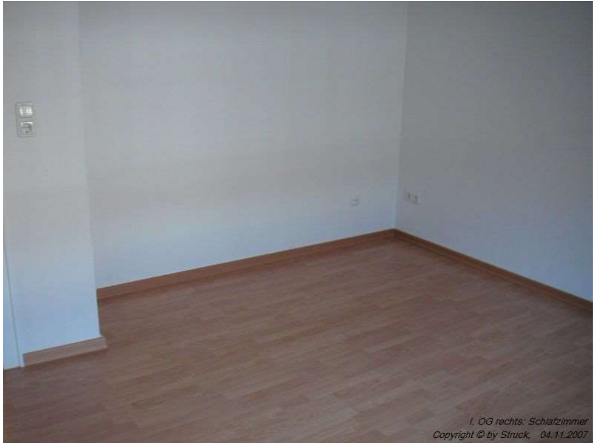
1. OG rechts: Schlafzimmer