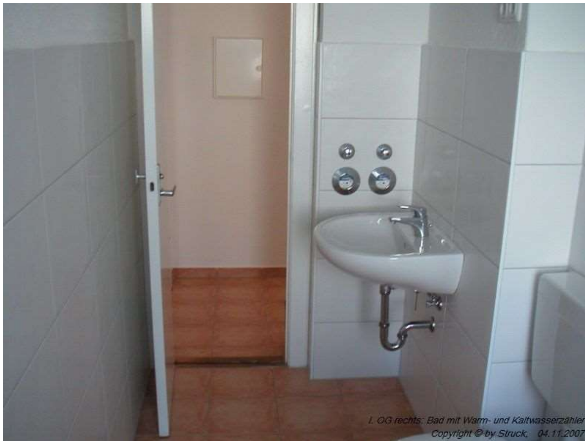
1. OG rechts: Bad mit Warm- und Kaltwasserzähler