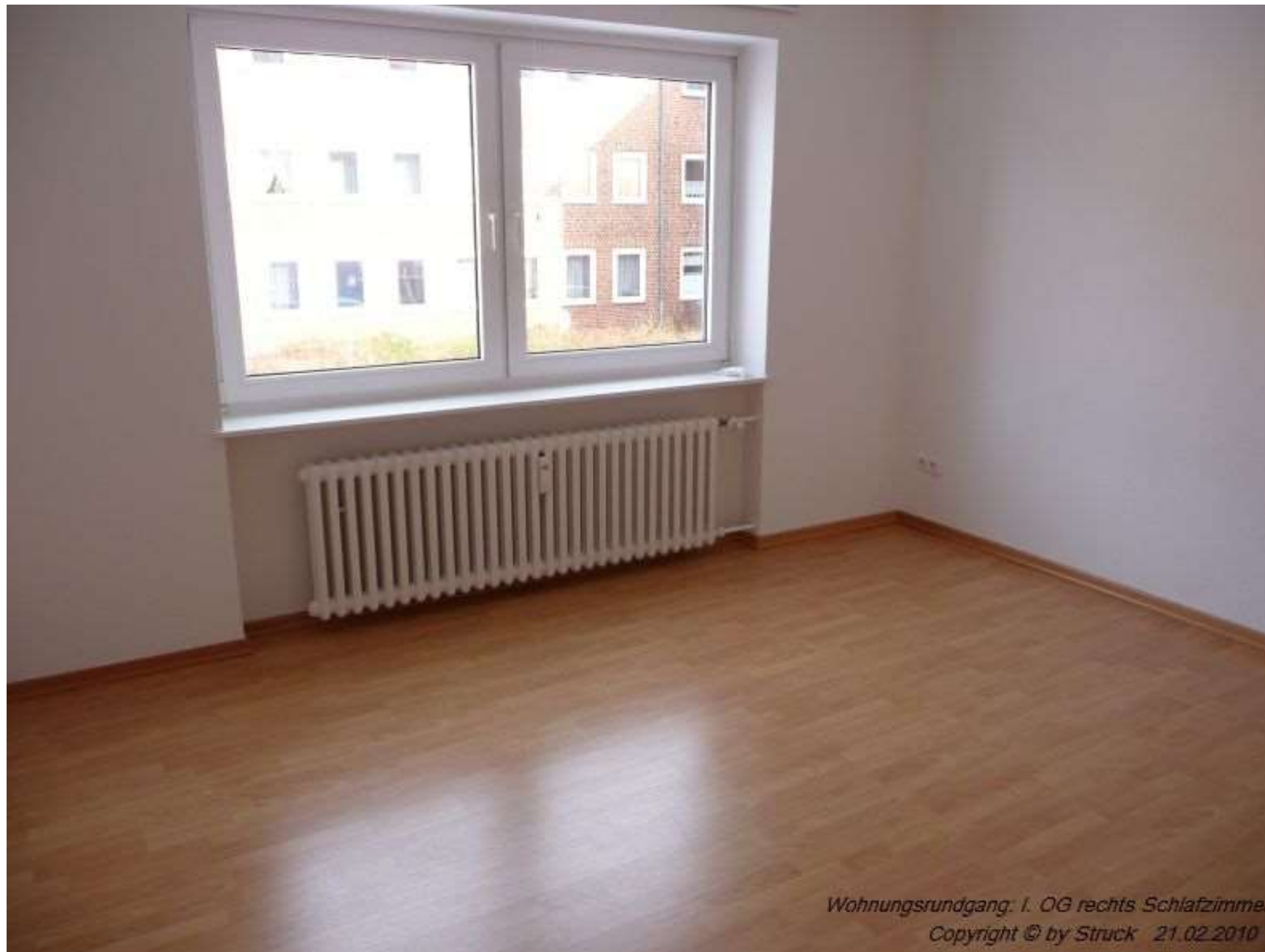
Wohnungsrundgang: 1. OG rechts Schlafzimmer