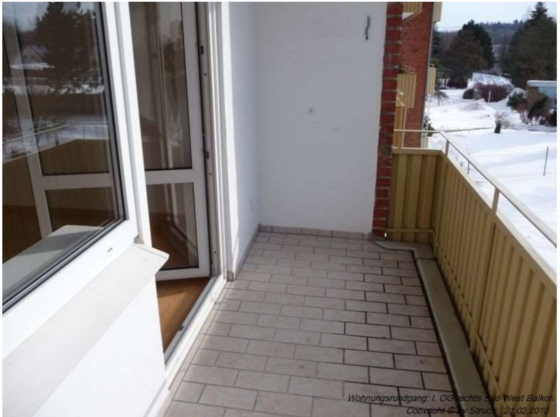
Wohnungsrundgang: 1. OG rechts Süd-West Balkon