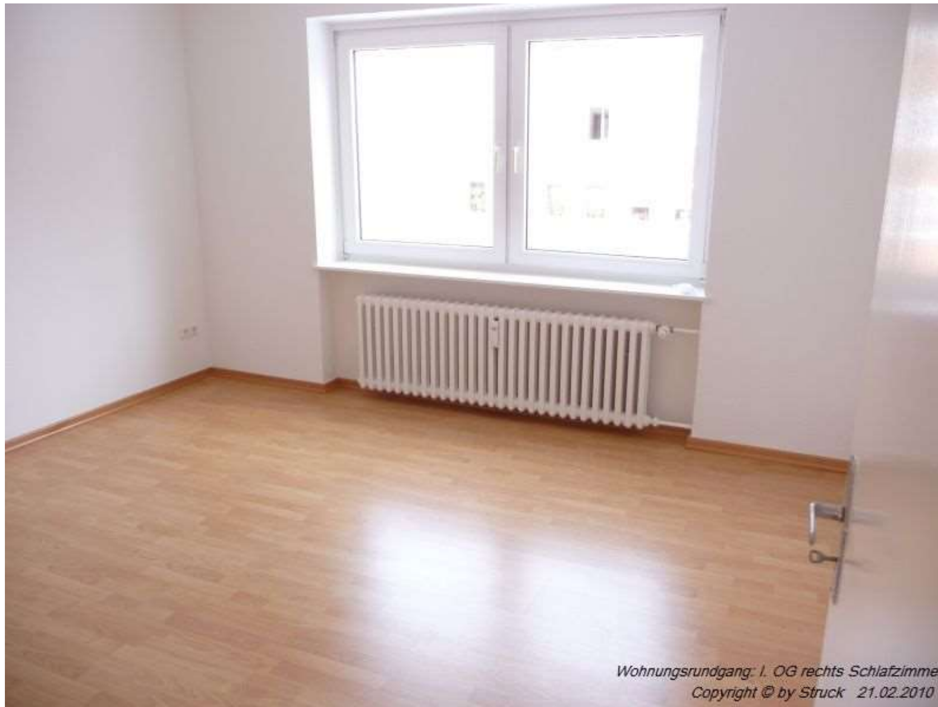
Wohnungsrundgang: 1. OG rechts Schlafzimmer 21.02.2010