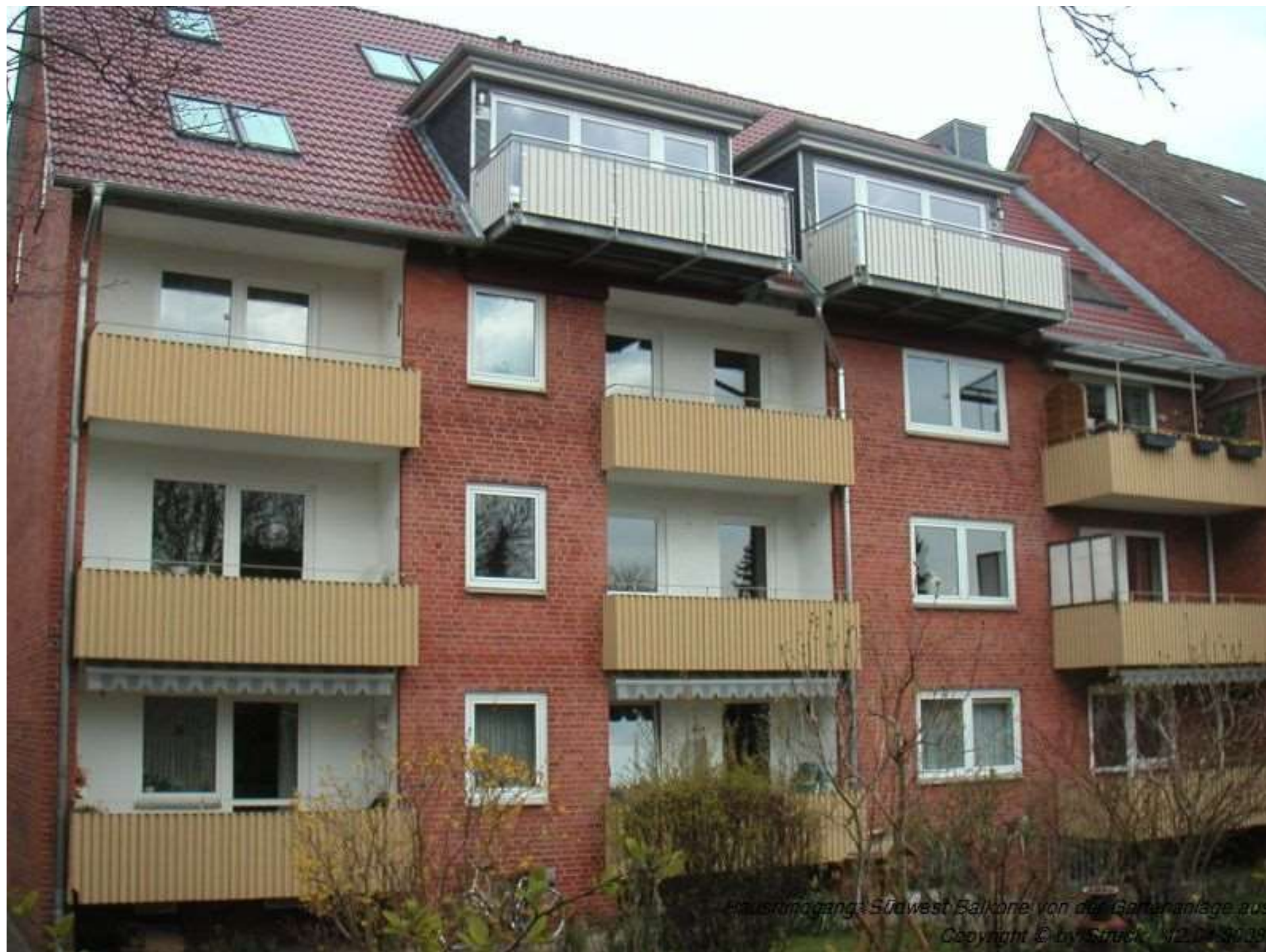
Hauszugang Südwest Balkone von der Gartenanlage aus 1/2019 30/39