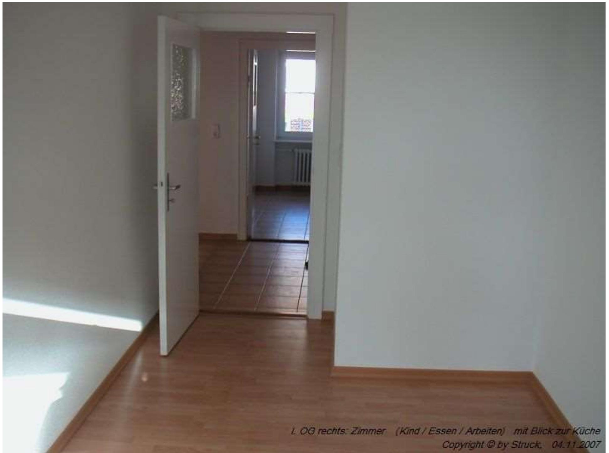
1. OG rechts: Zimmer (Kind / Essen / Arbeiten) mit Blick zur Küche