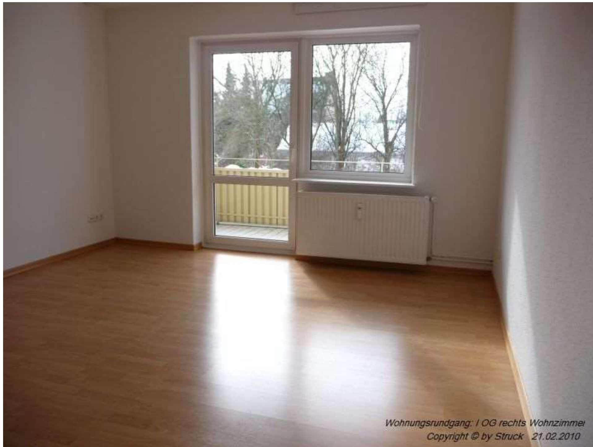
Wohnungsrundgang: 1 OG rechts Wohnzimmer