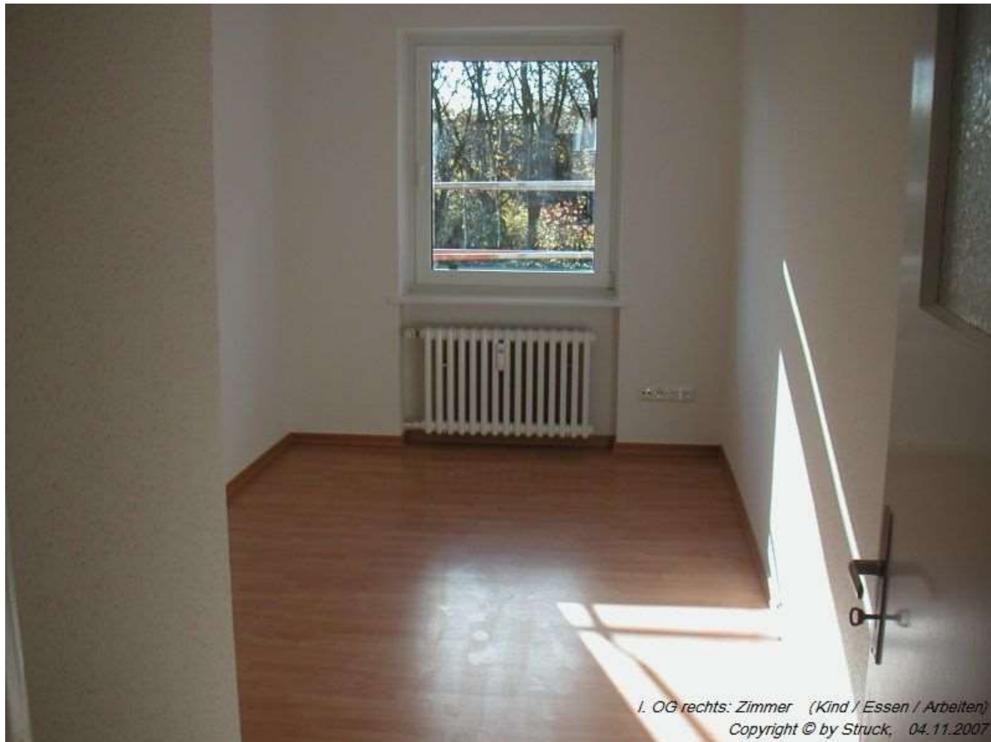
1. OG rechts: Zimmer (Kind / Essen / Arbeiten)