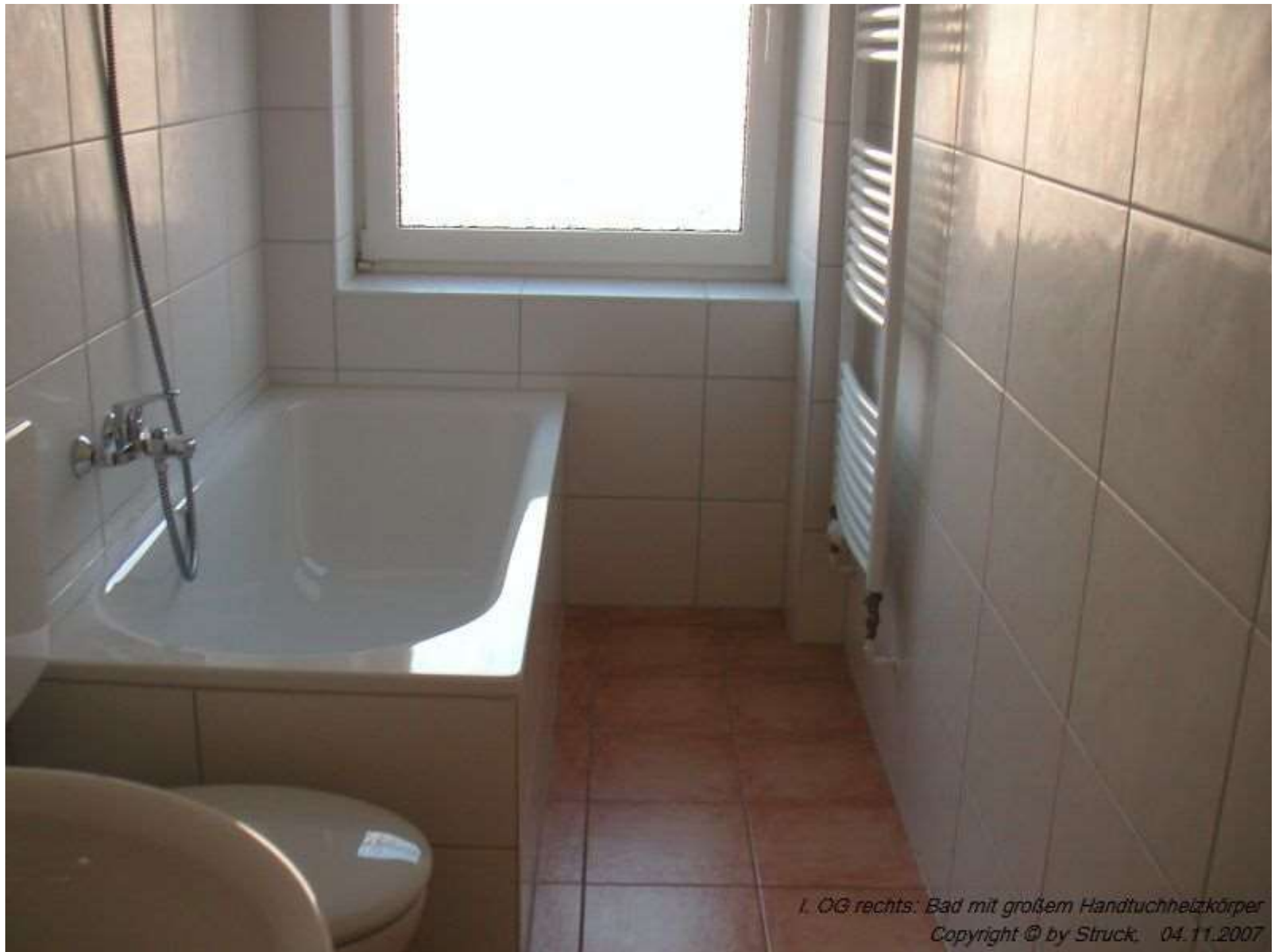
1. OG rechts: Bad mit großem Handtuchheizkörper 04.11.2007