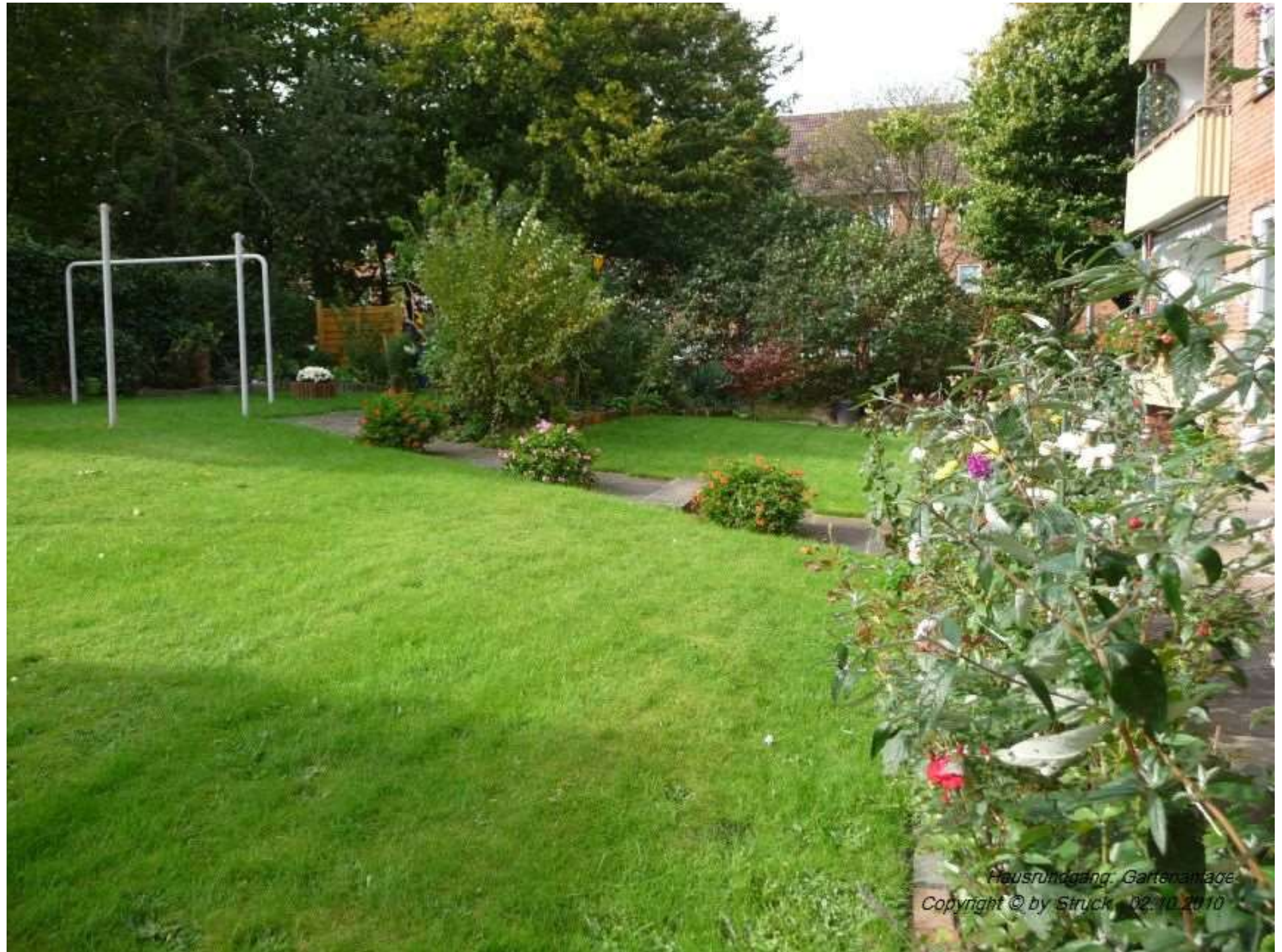
Hausrundgang: Gartenanlage