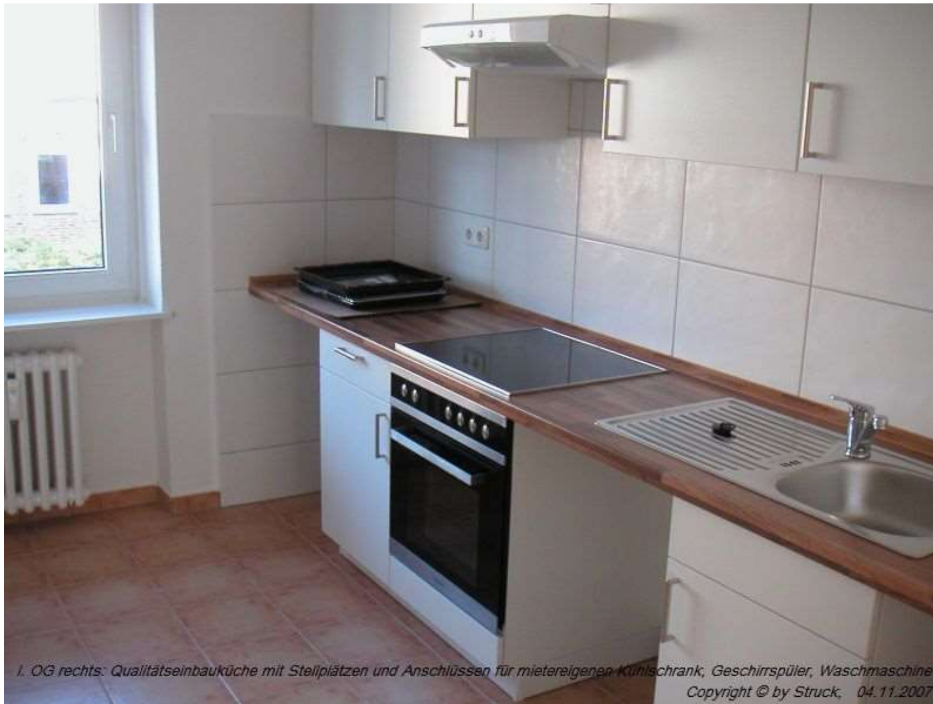
1. OG rechts: Qualitätseinbauküche mit Stellplätzen und Anschlüssen für mietereigenen Kühlschrank, Geschirrspüler, Waschmaschine