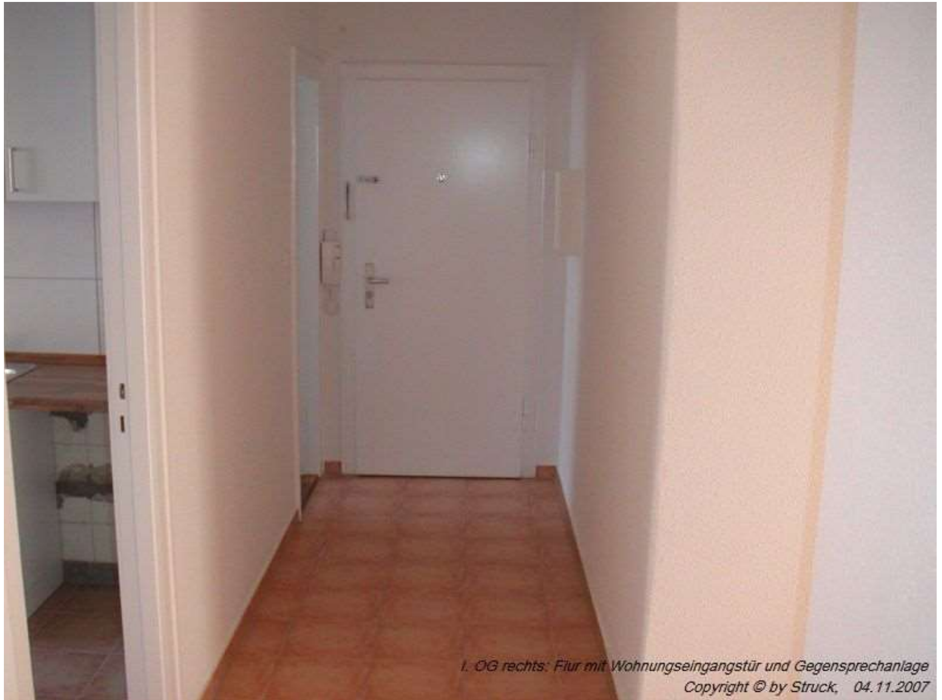
1. OG rechts: Flur mit Wohnungseingangstür und Gegensprechanlage