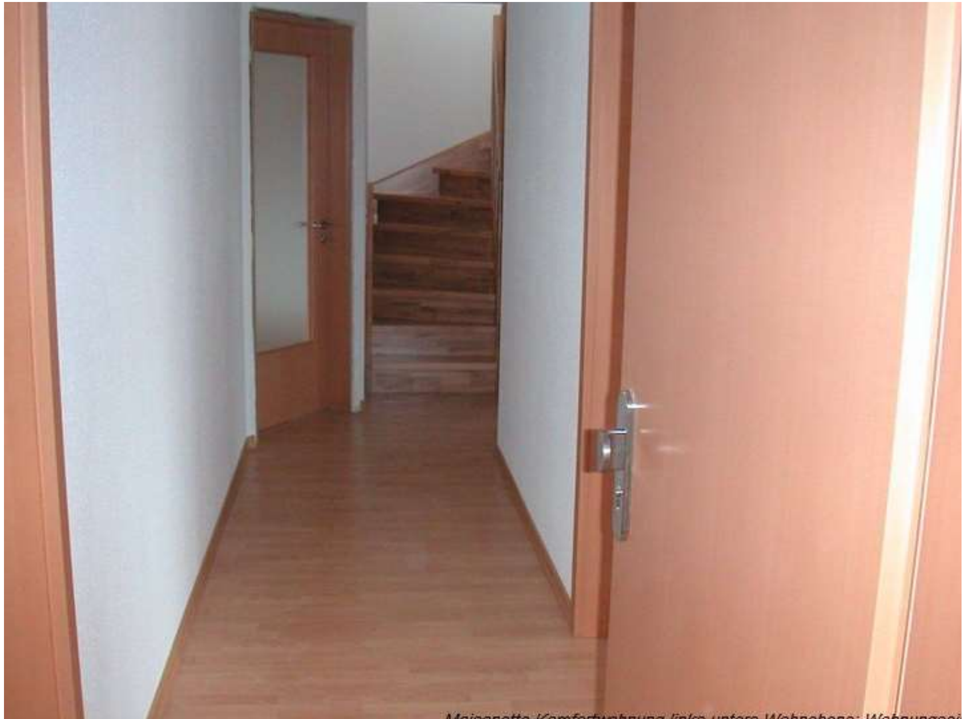
Meisnerette-Konferenzraum links unten Wohnbereich Wohnungsein