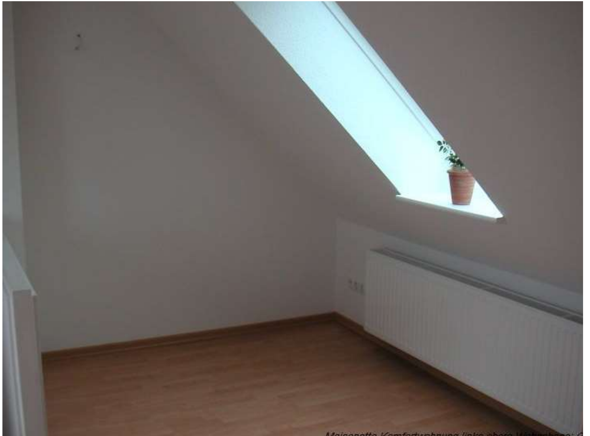
Maisonette, Komfortwohnung, links oben, 12.05.2012