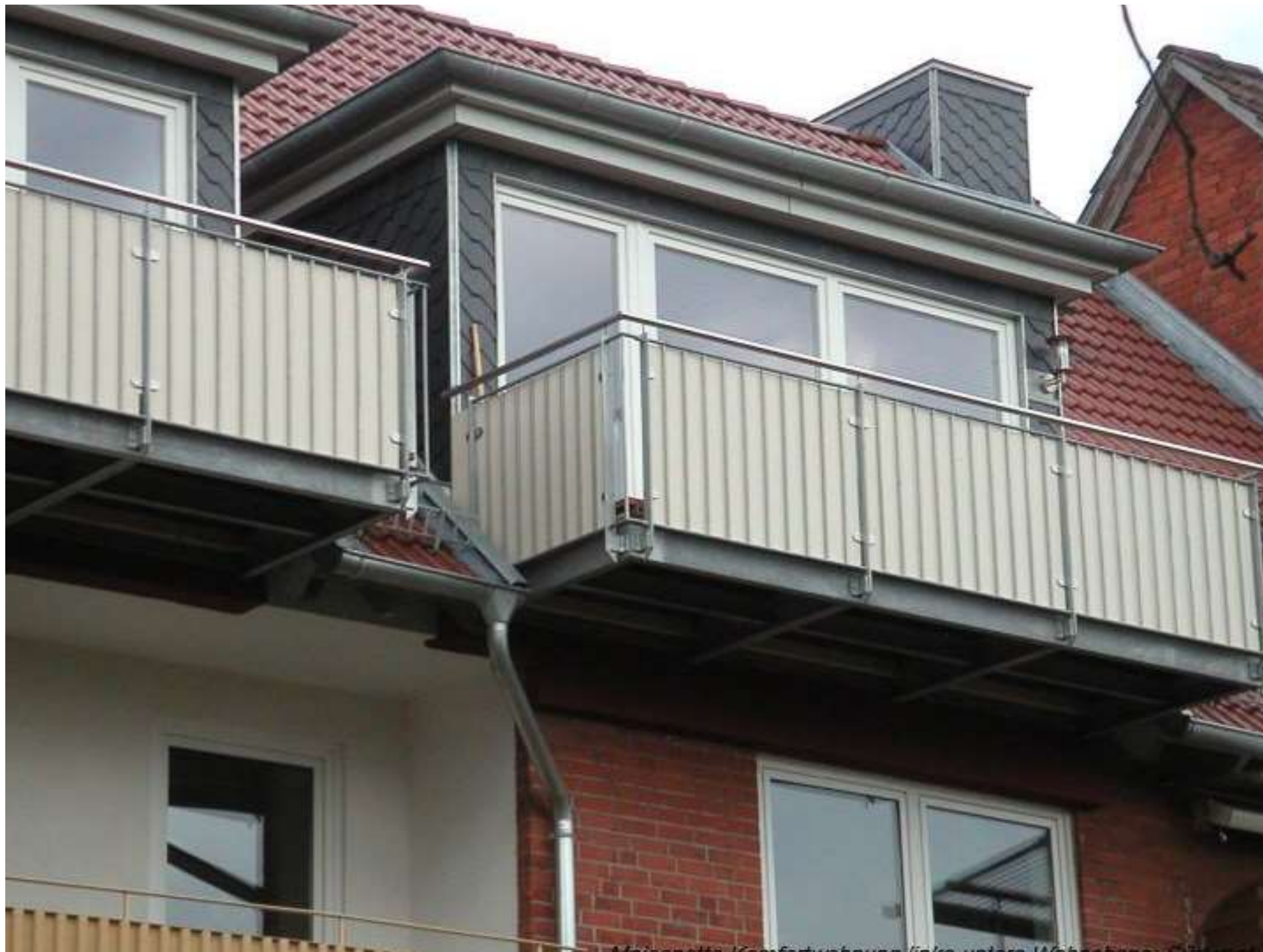
Meisneta, Komfortwohnung links unten, Wohnhaus