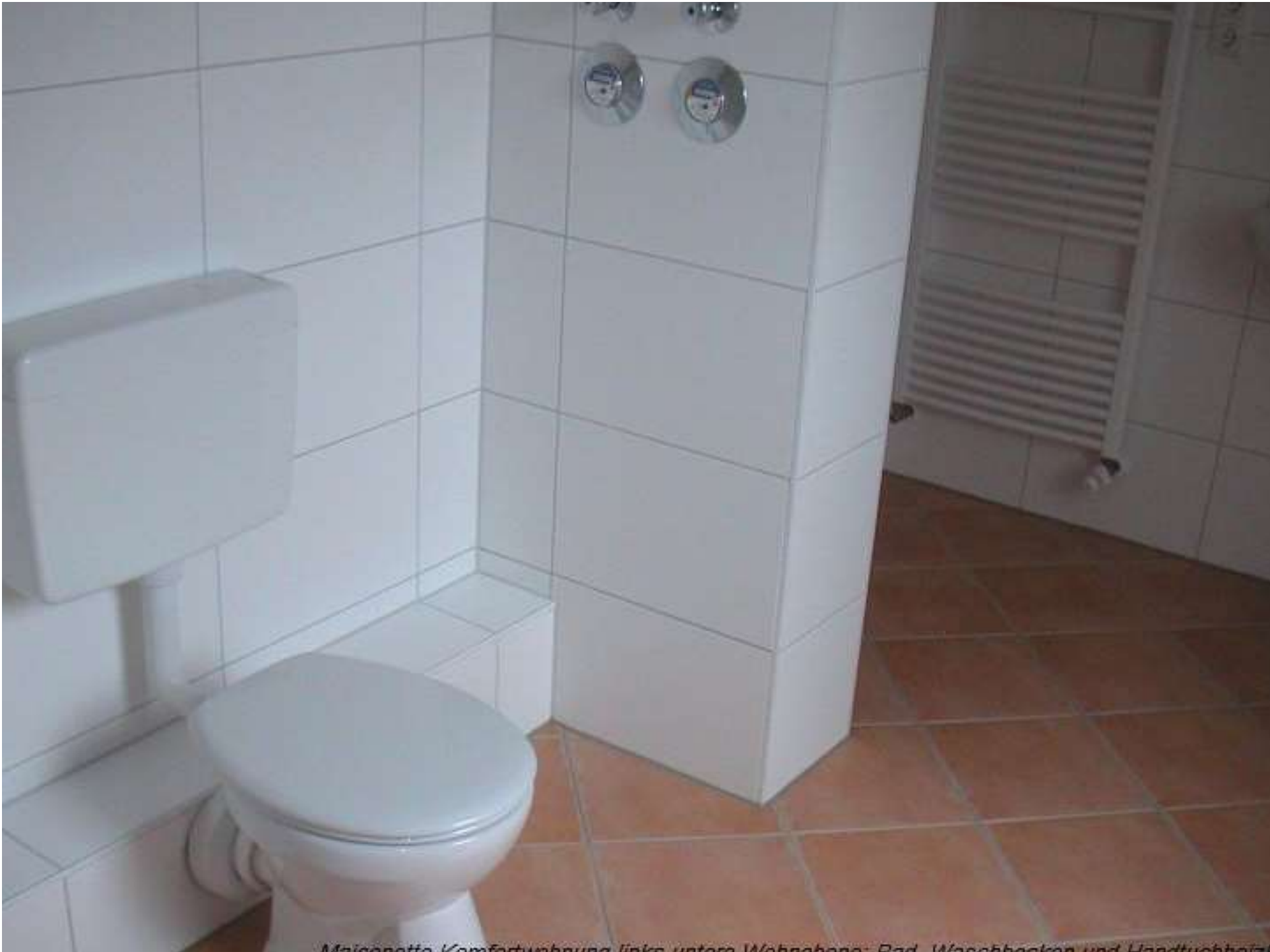
Maionetta Komfortwohnung links unten Wohnbereich Bad, Waschbecken und Handtuchheiz