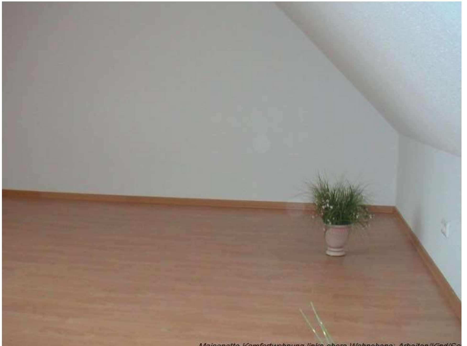
Maisonette Komfortwohnung links oben Wohnbereich: Arbeiten/Kind/So