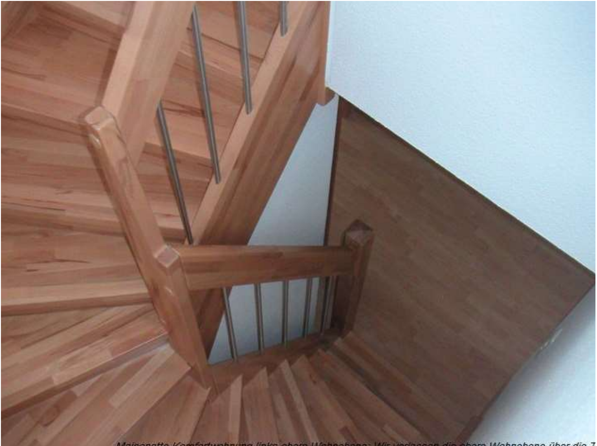
Maisonette / Komfortwohnung links oben Wohnbereich. Wir verlassen die obere Wohnzone über die T