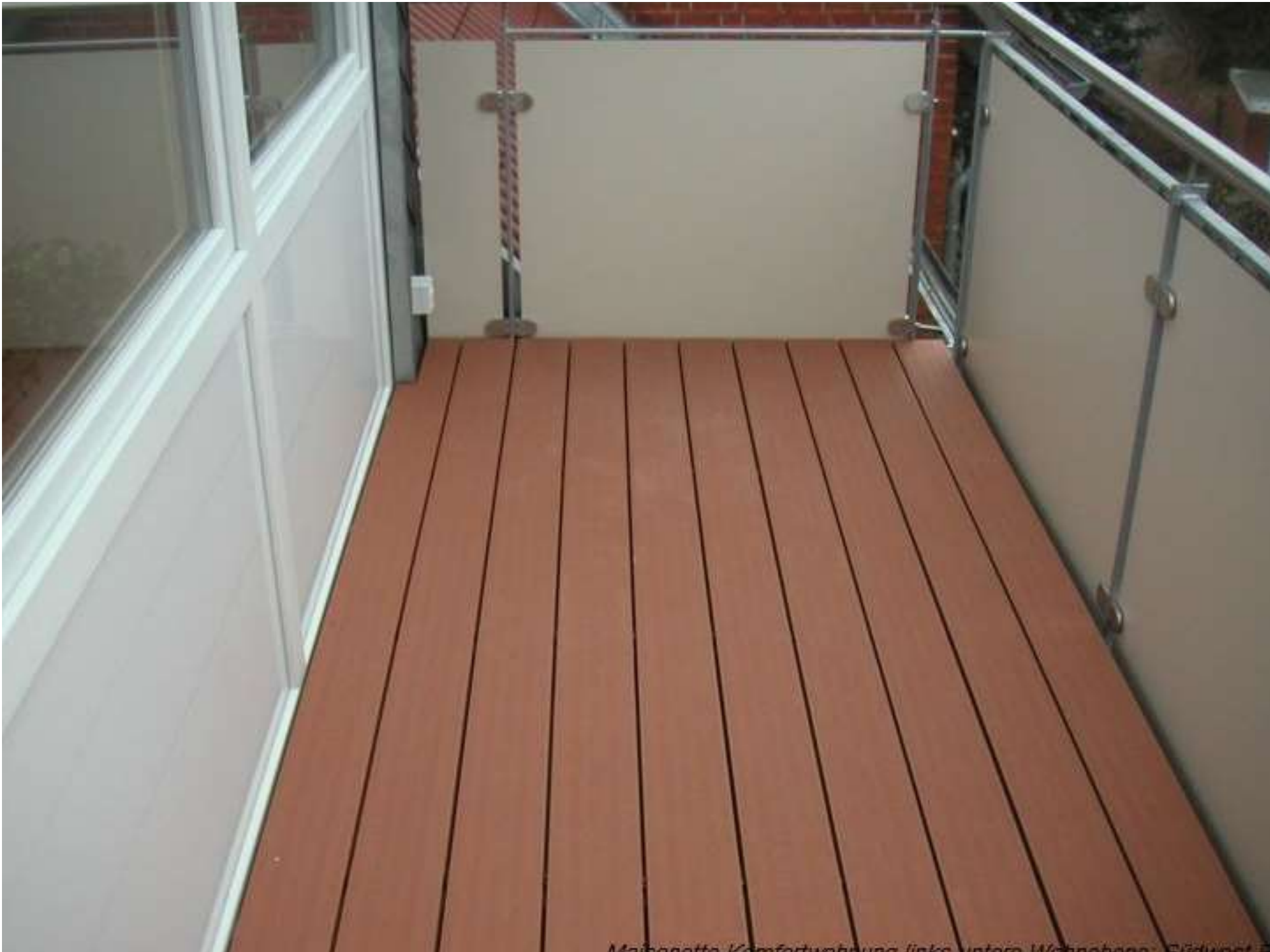
Maiballett, Komfortuhnung links unten, Wannabene, Fildunet