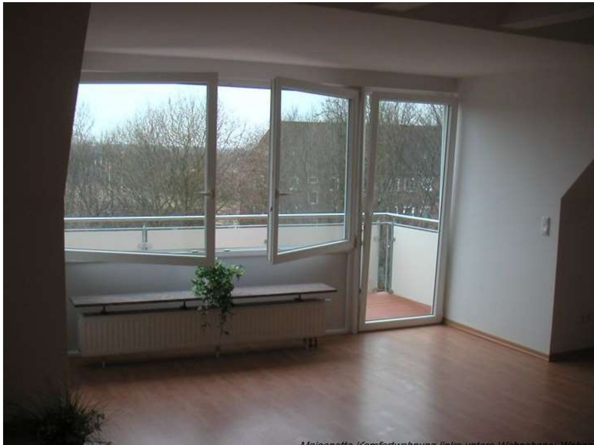
Maisonne: Komfortwohnung links unten: Wohnbereich: Wohnraum