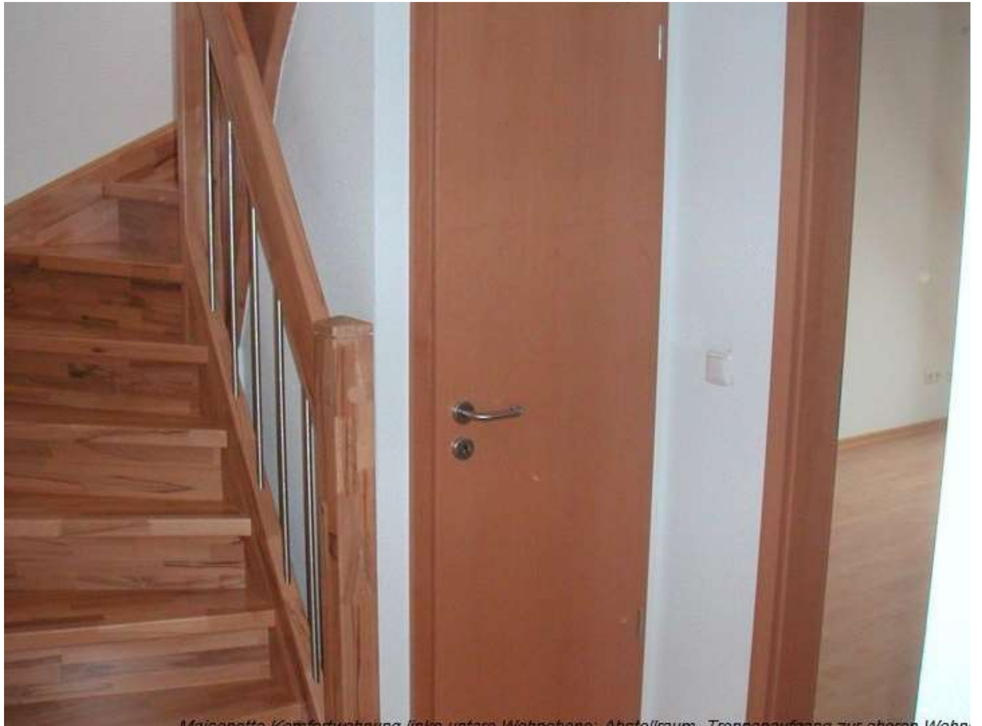
Meisencotte, Komfodichtung links unten Wohnzone, Abstellraum, Treppenaufgang zur oberen Wohnzone