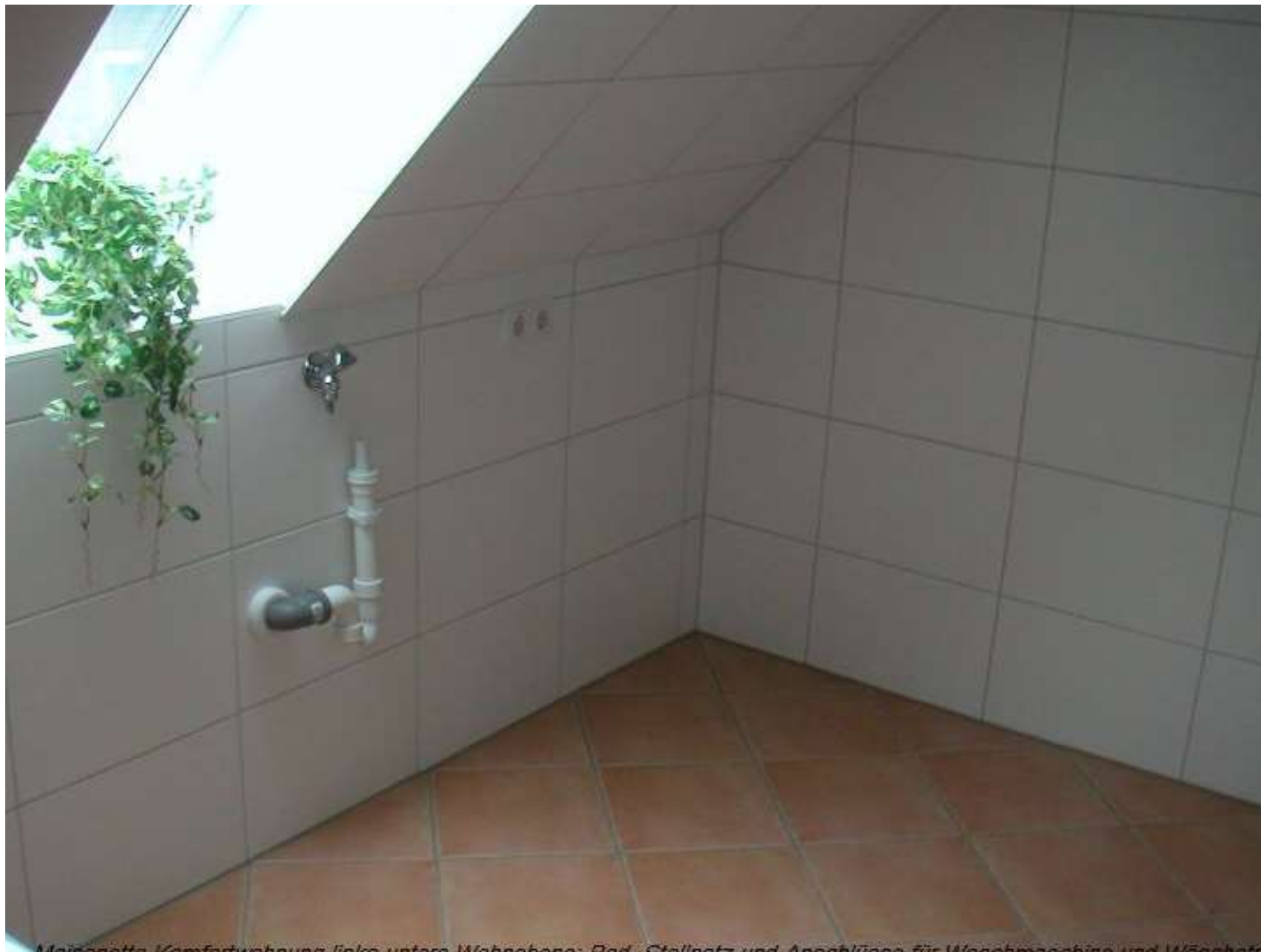
Meißnitzer Konfekturherstellung links unten Wohnzone Bad, Stellnetz und Anschlüsse für Waschmaschine und Wäschetrockner