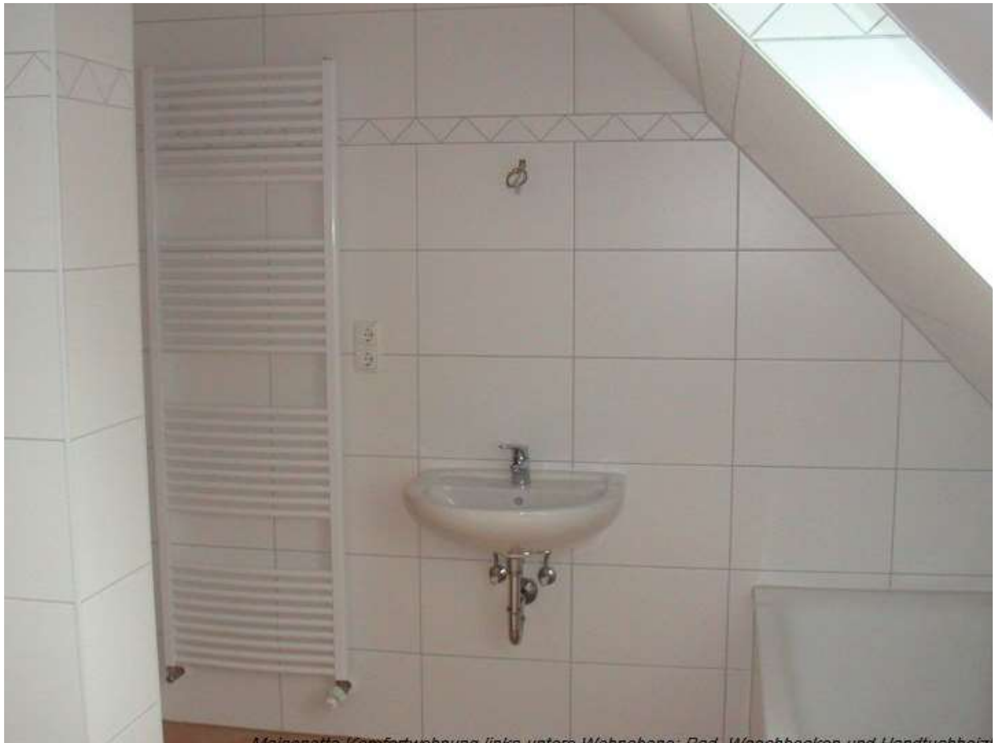
Meisnerolle Konfortwohnung links unten: Wappstein, Bad, Waschbecken und Handtuchhalter