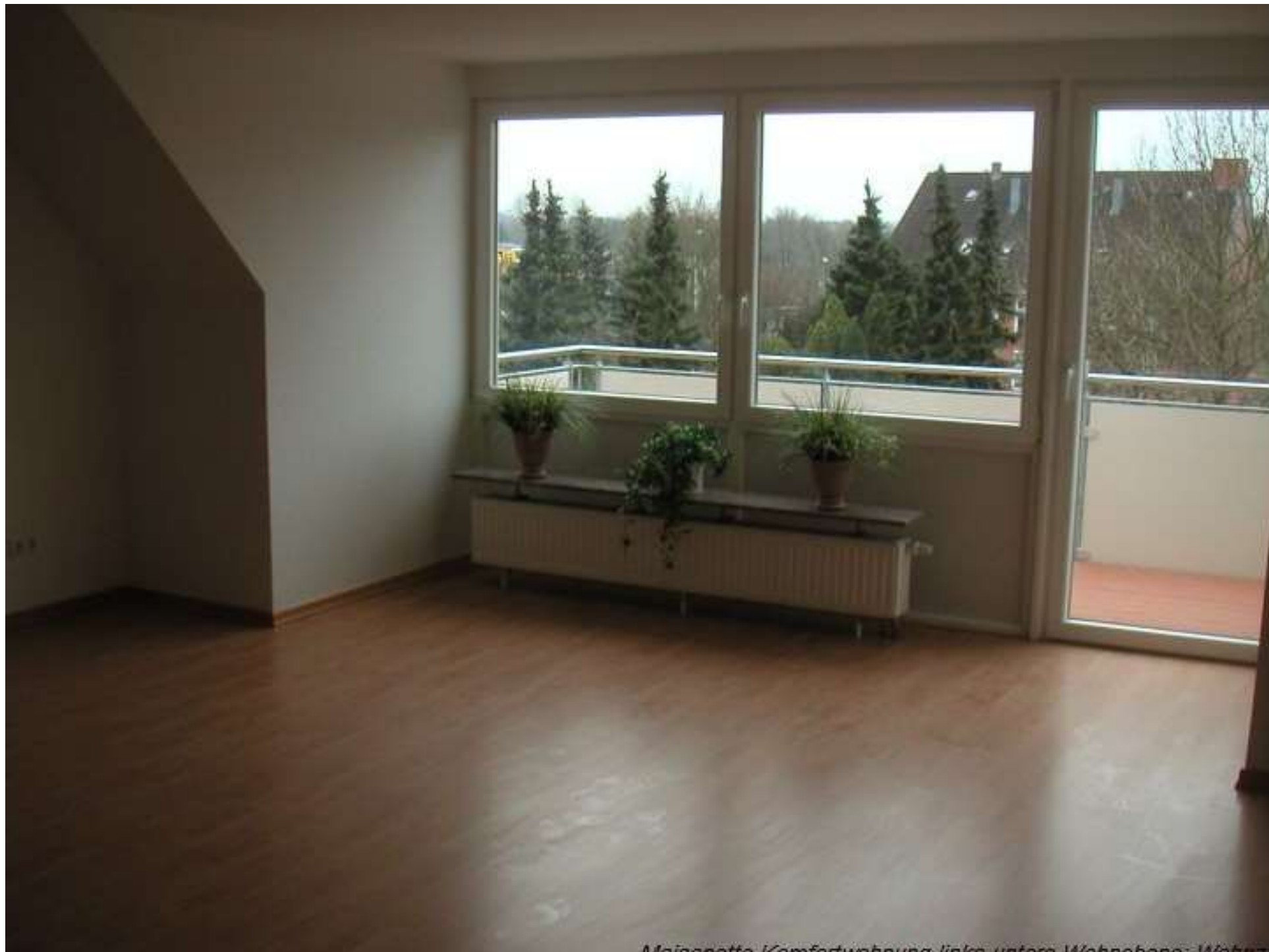
Maispötte: Komfortwohnung links unten: Wohnbereich: Wohnraum