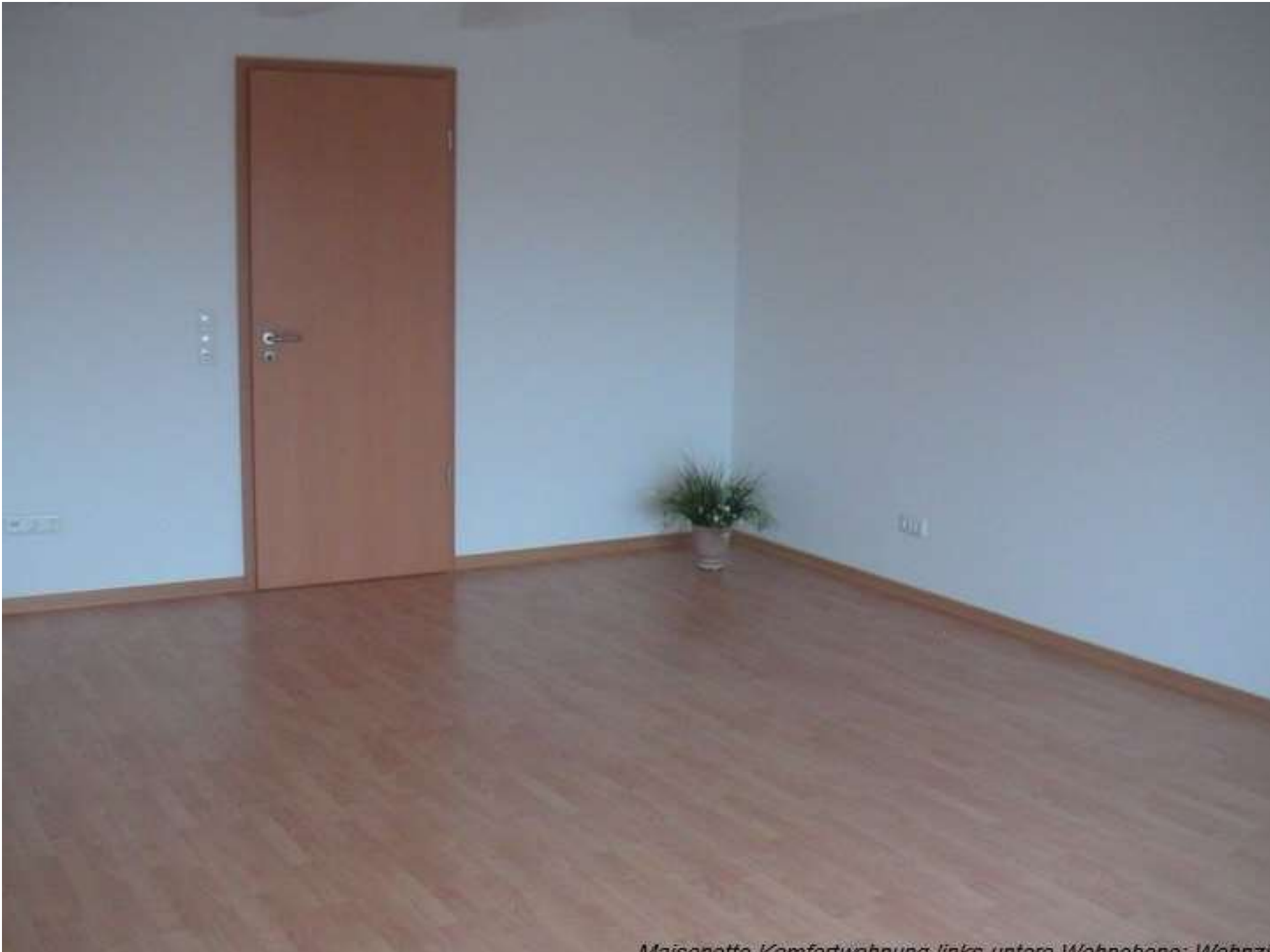
Maisonette, Komfortwohnung links unten, Wohnbereich, Wohnz.