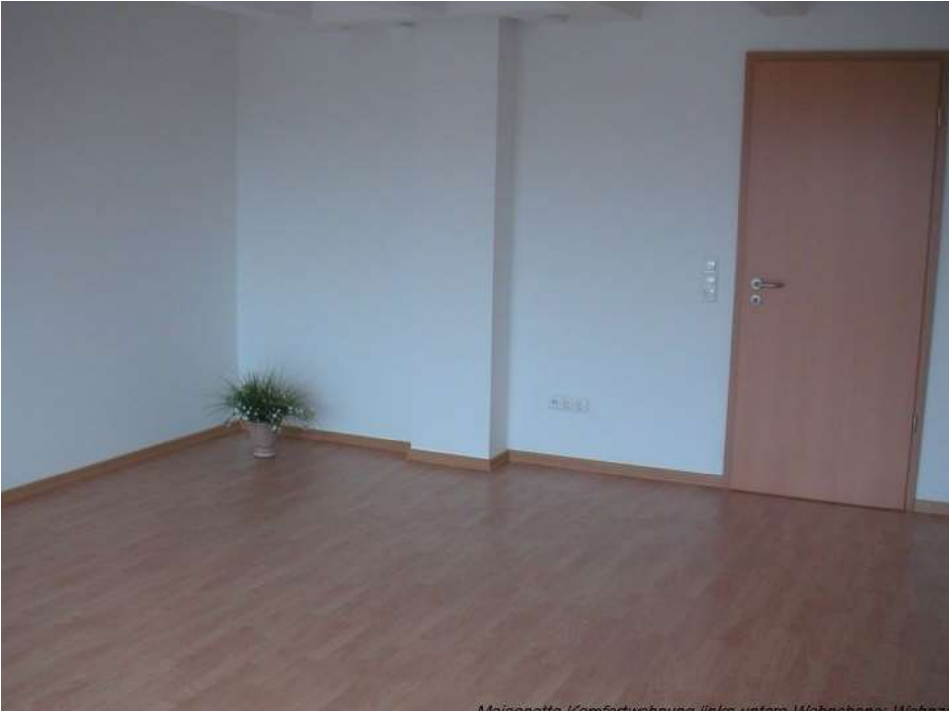
Maionette, Komfortuhnung links unten, Mahabona, Mahabona