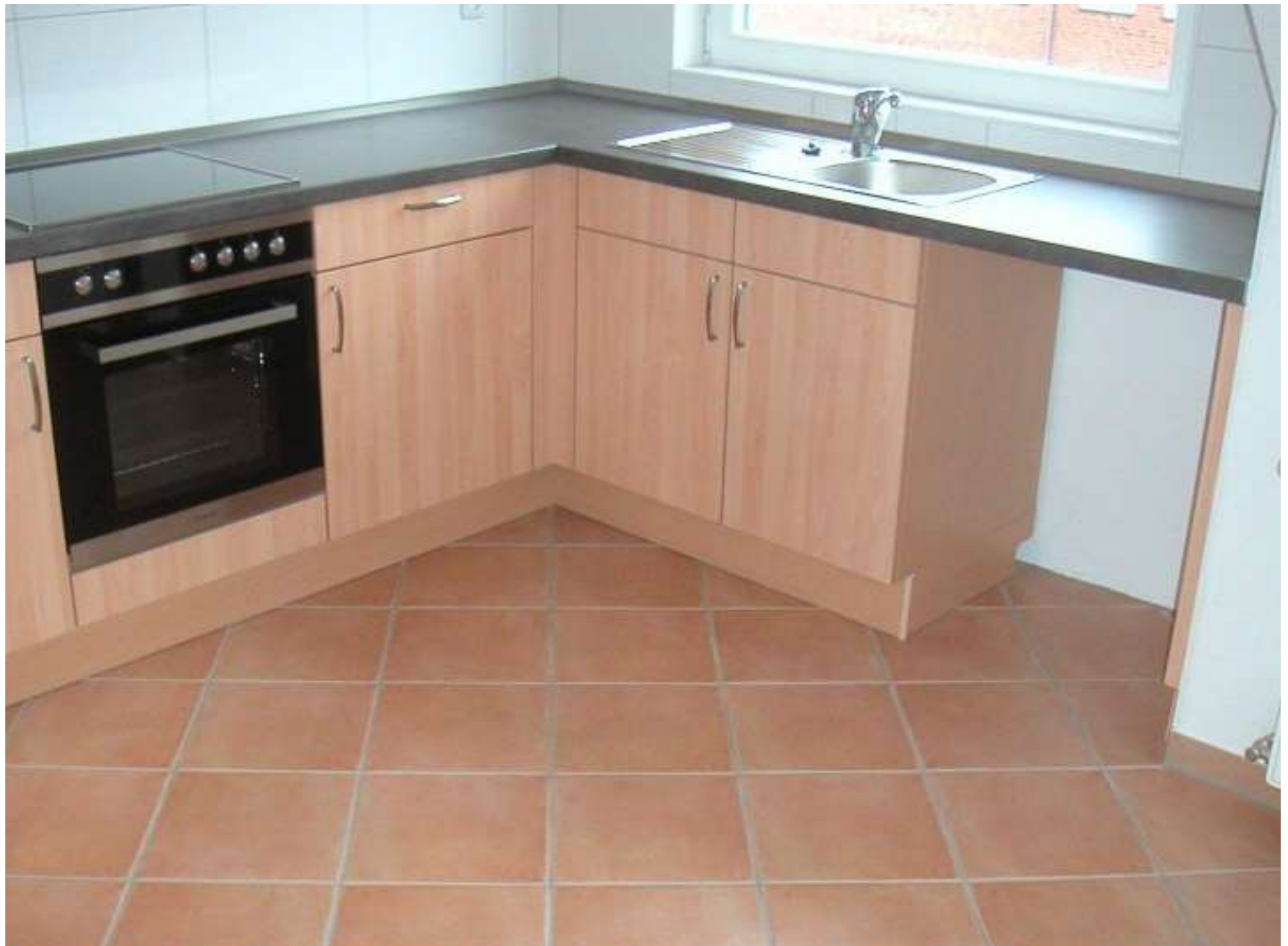
Meisnitzer Komfortwohnung links unten: Wohnbereich: Qualitätseinbauküche mit Stellplatz für niedrige Geschirrspüler