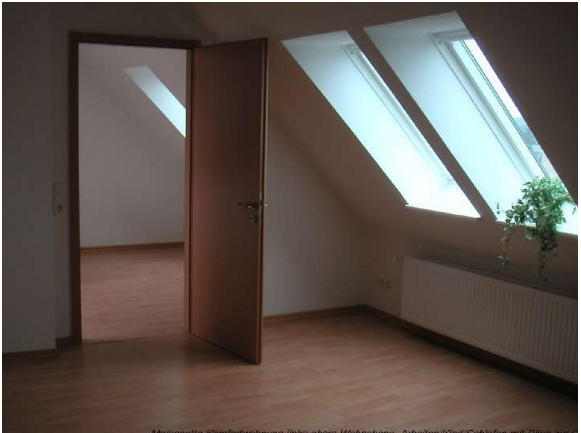
Maiconette: Komfortwohnung links-obere Wohnzone: Arbeiten/Kind/Schlafen mit Blick auf