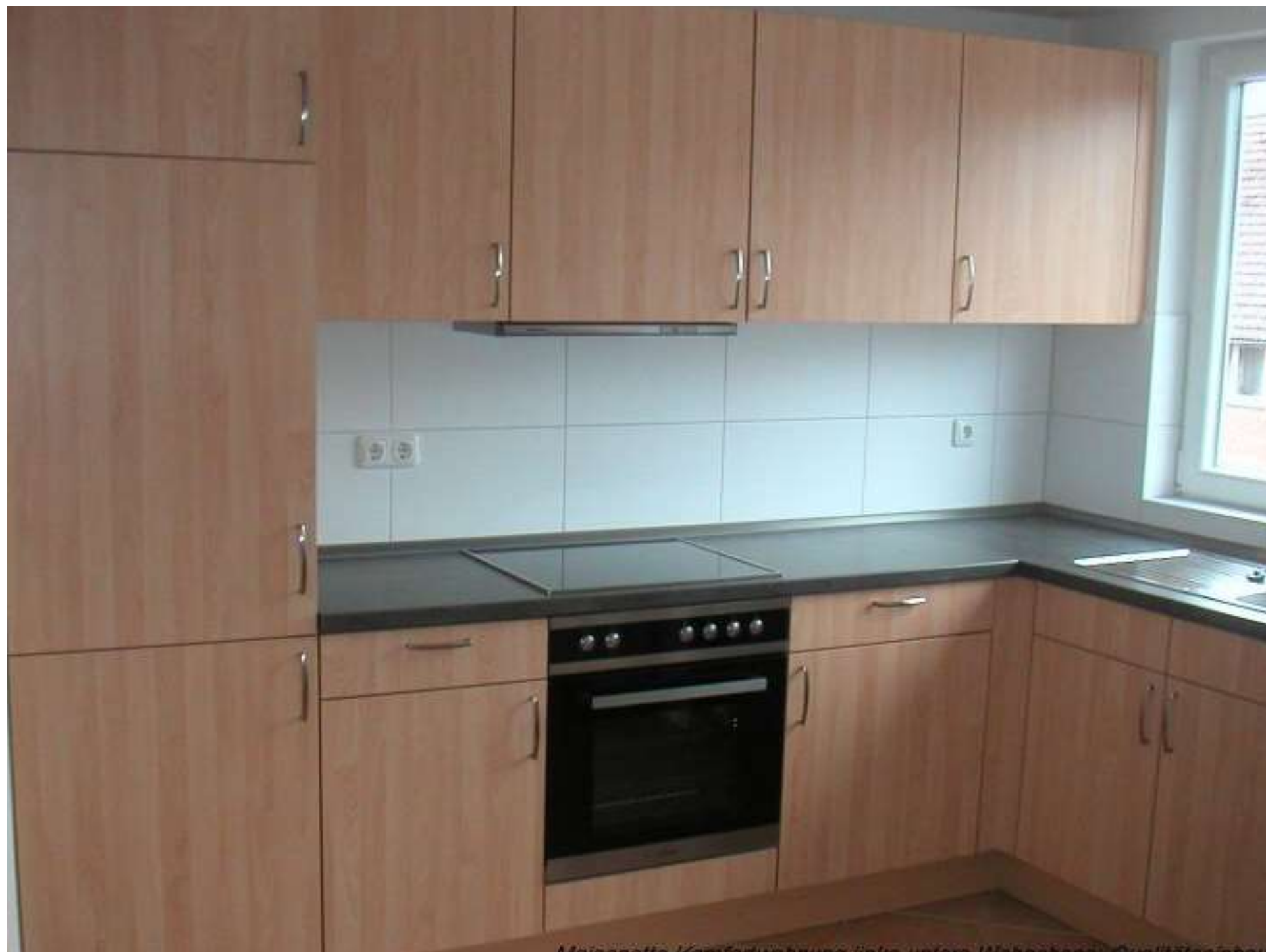
Miscroto - Komfort und mehr in der Küche