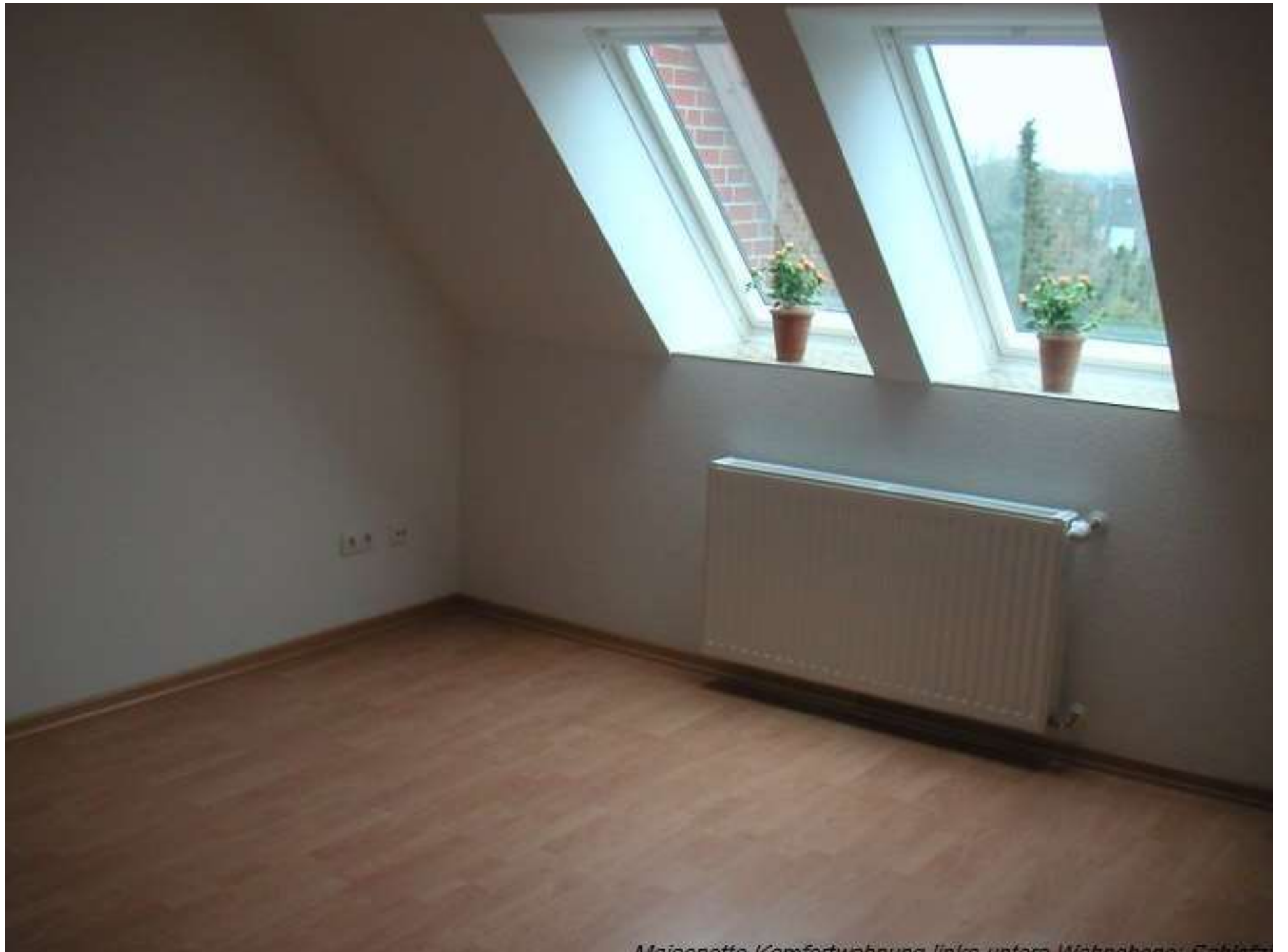
Mezzanette Komfortwohnung links unten Wohnbereich Schließ