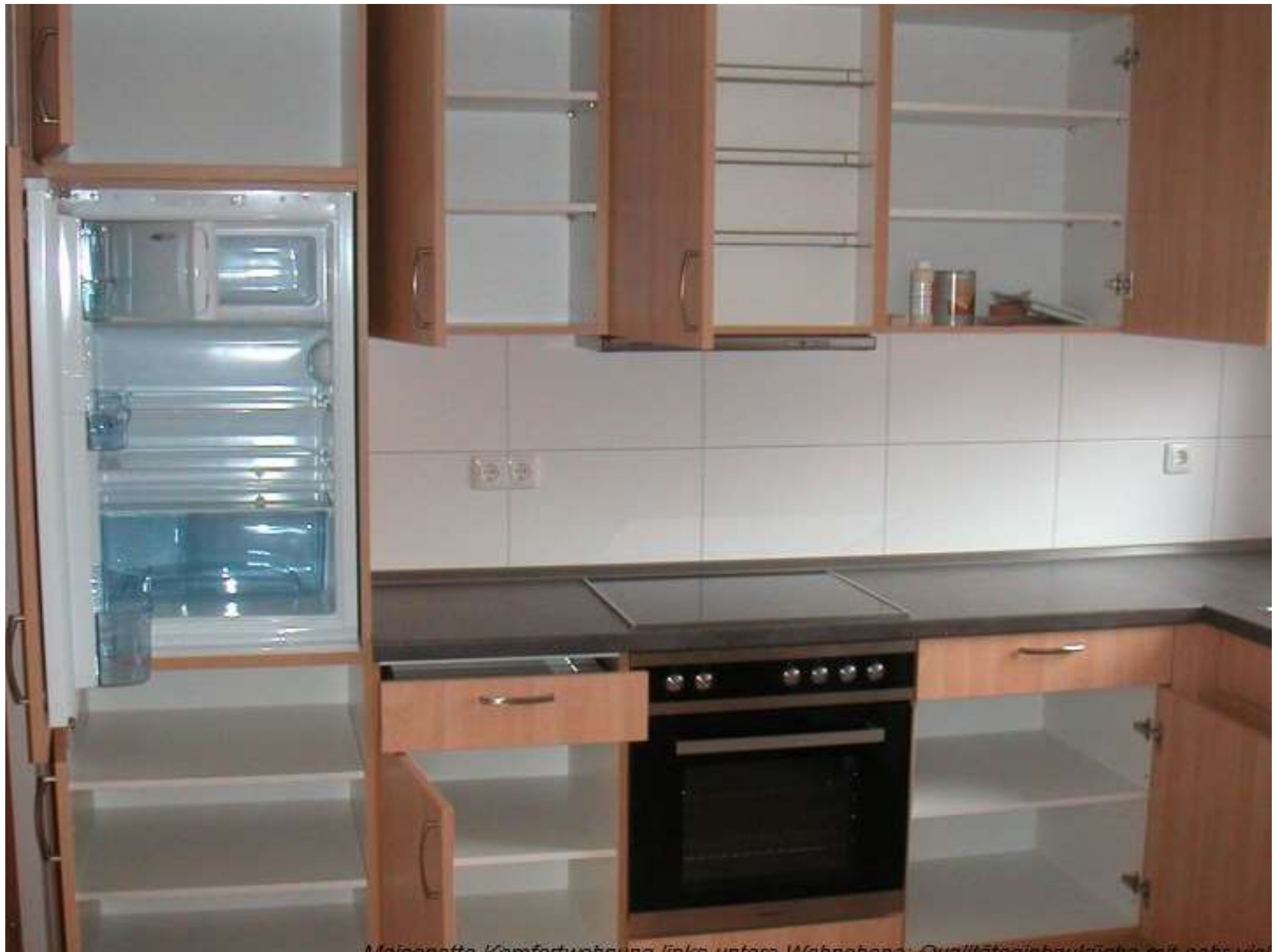
Meinette Komfortwohnung links unten Wohnbereich Qualitätseinbauküche mit elektrischer