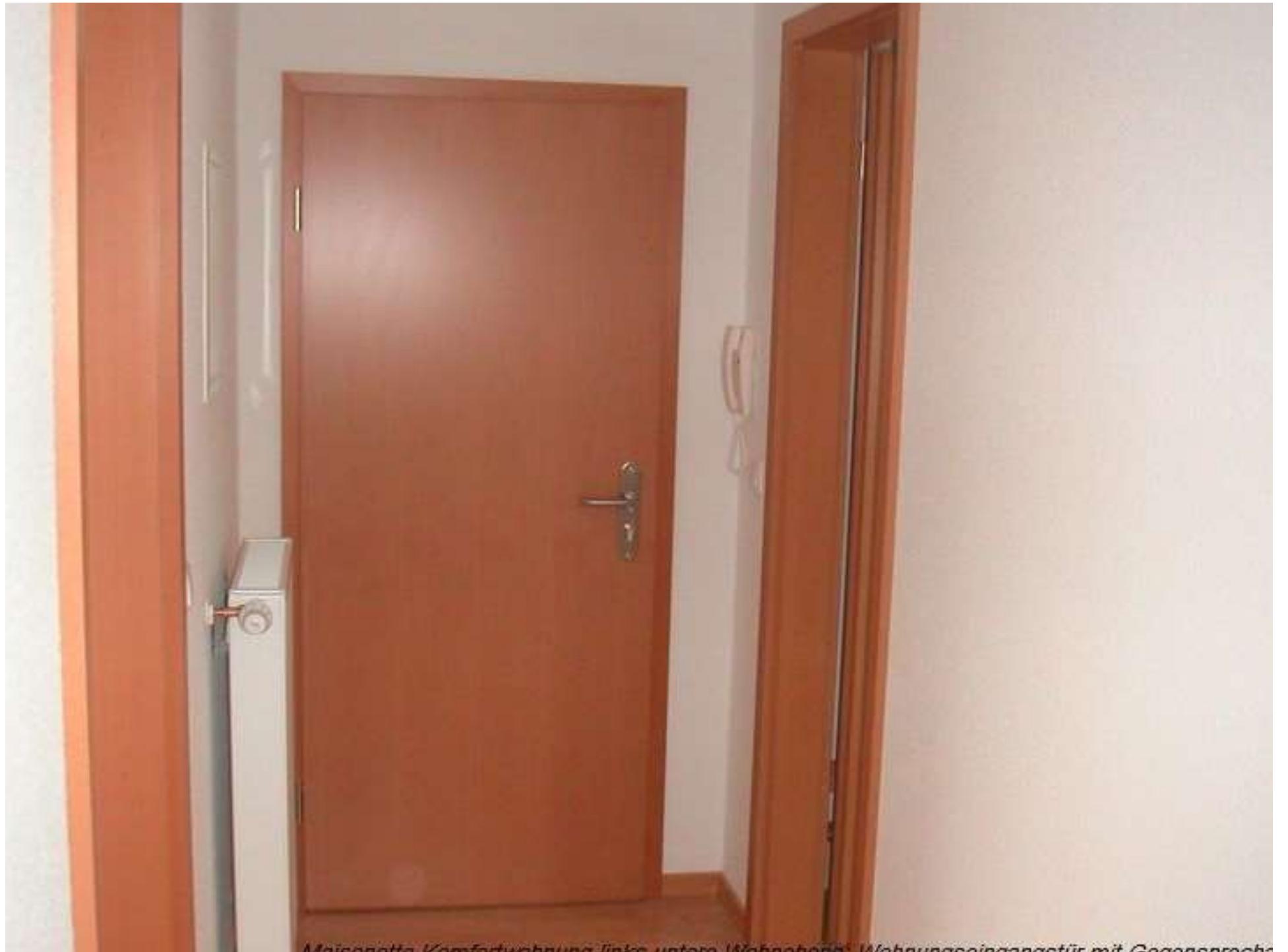
Maisonette, Komfortwohnung links unten, Wohnbereich, Wohnungseingangstür mit Gegensprecher