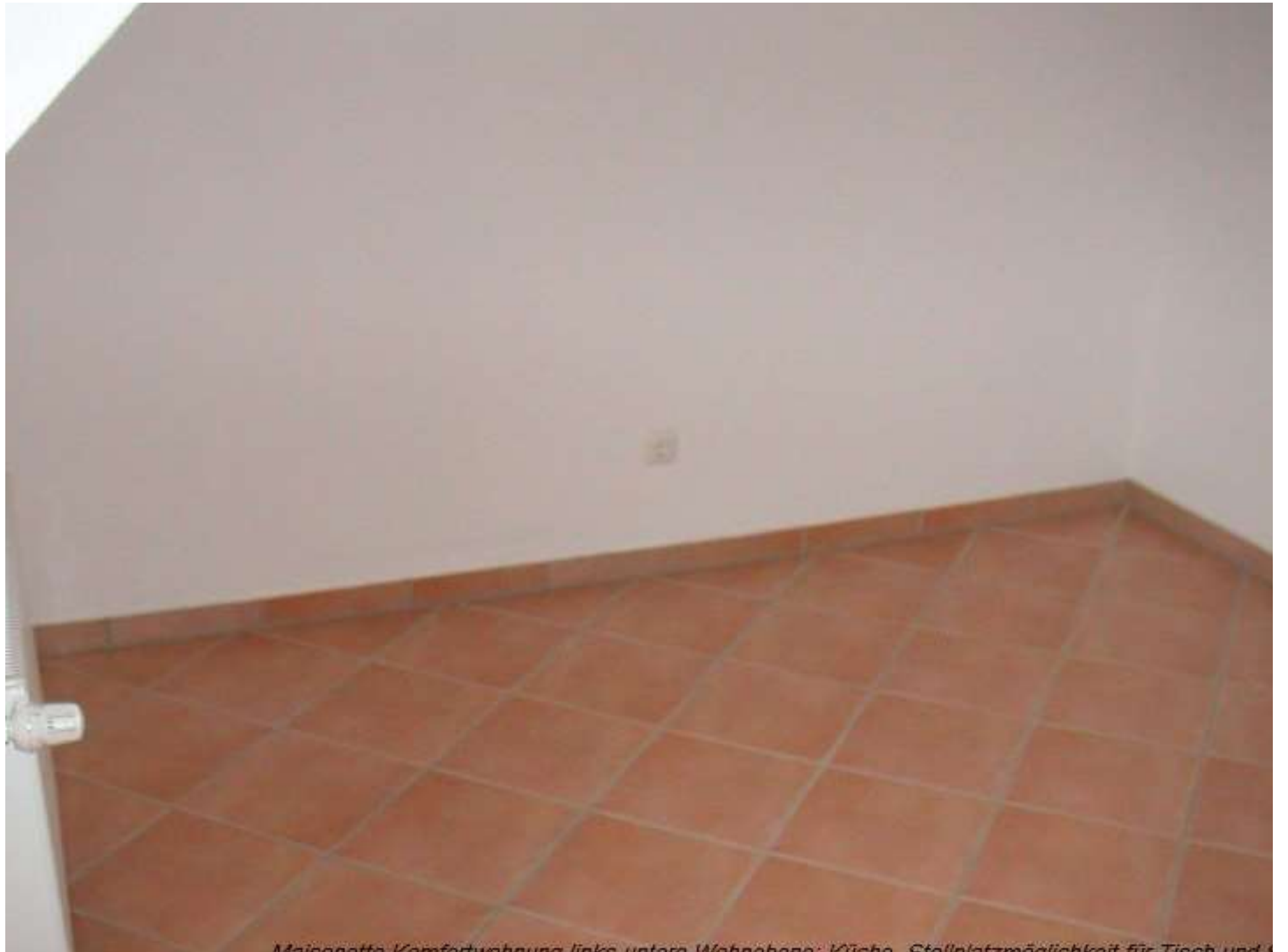
Meinnetta-Komfortwohnung links unten: Wohnzone: Küche. Stellplatzmöglichkeit für Tisch und