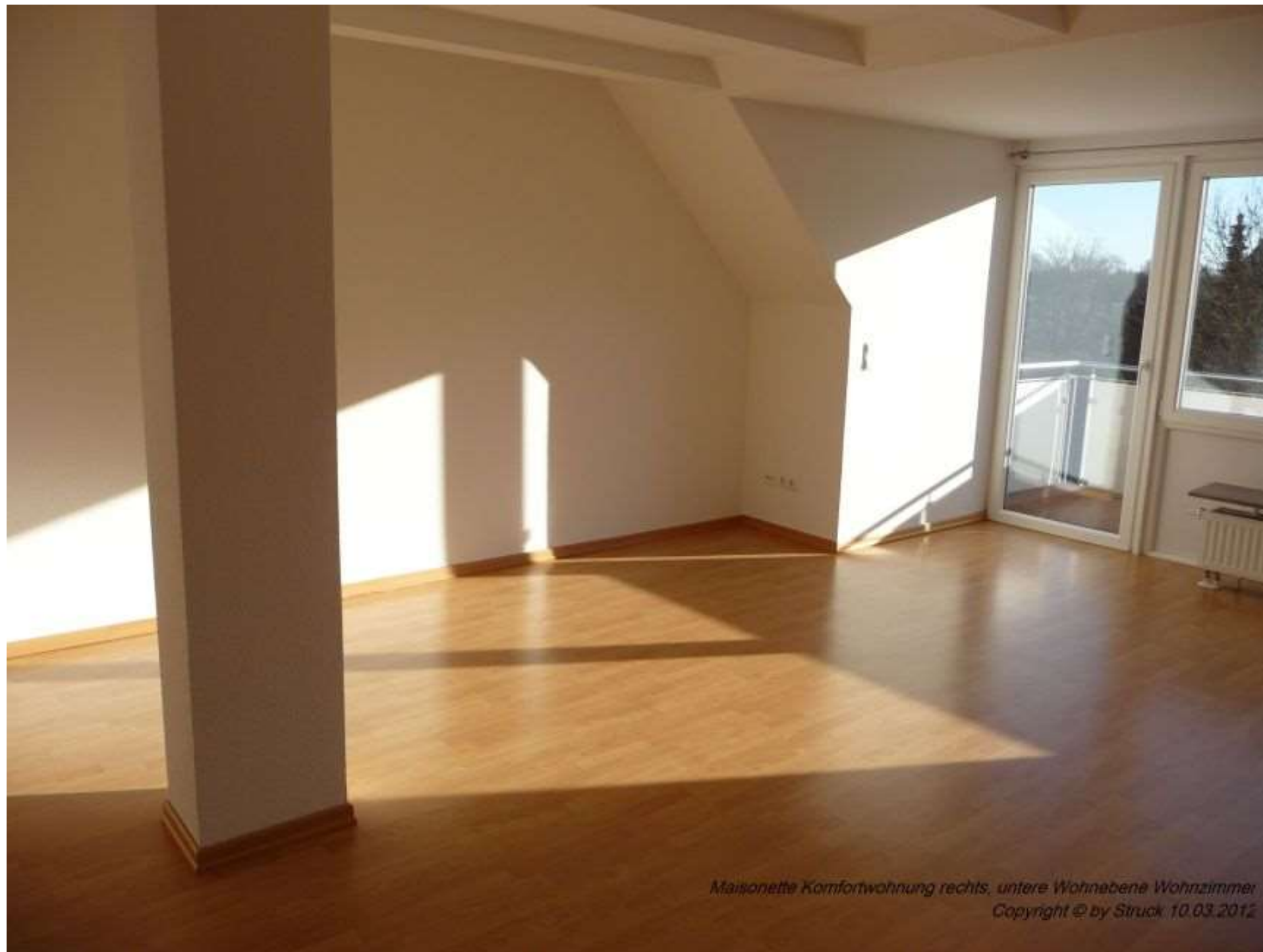
Maisonette Komfortwohnung rechts, untere Wohnebene Wohnzimmer