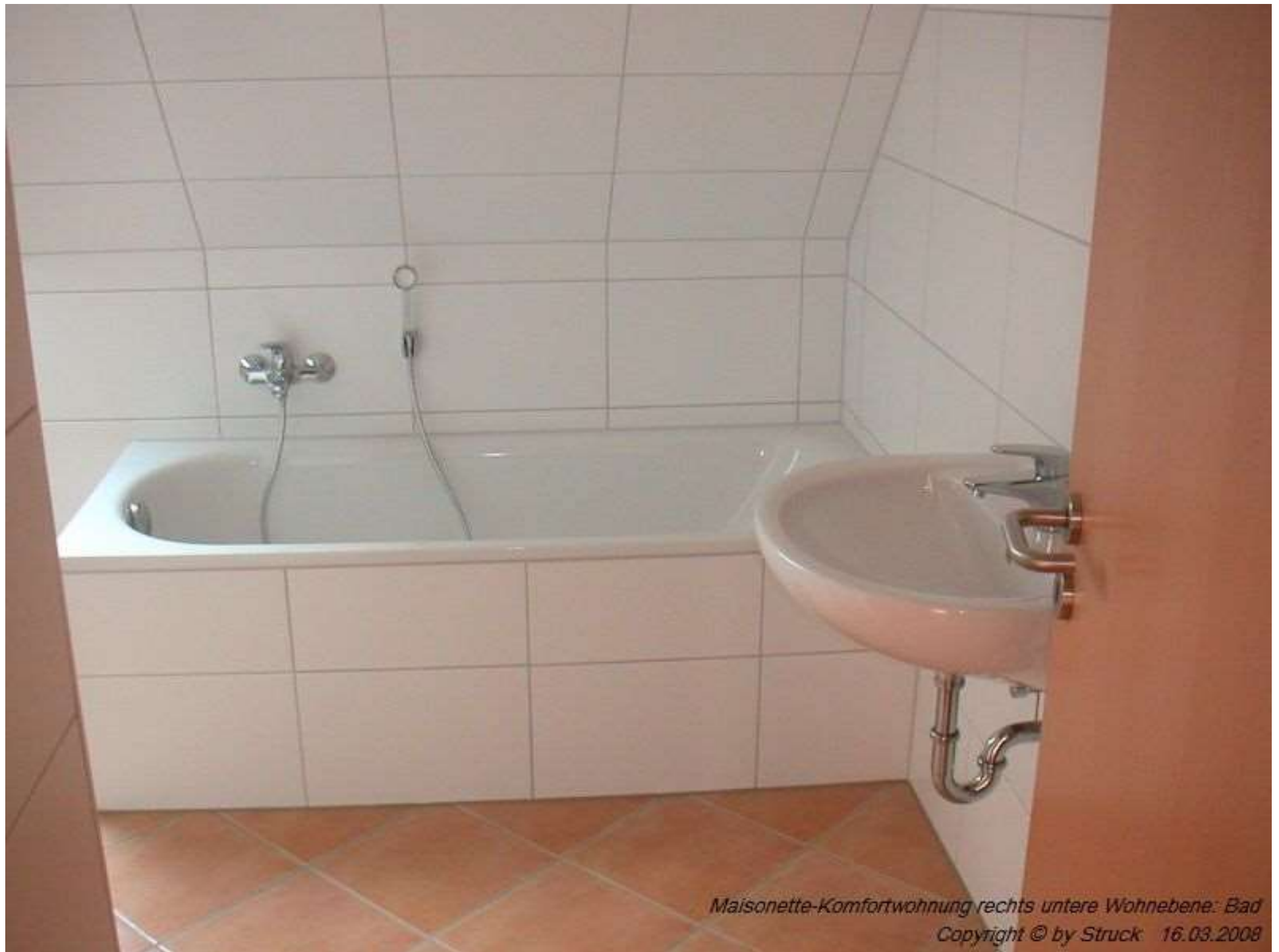
Maisonette-Komfortwohnung rechts untere Wohnebene: Bad