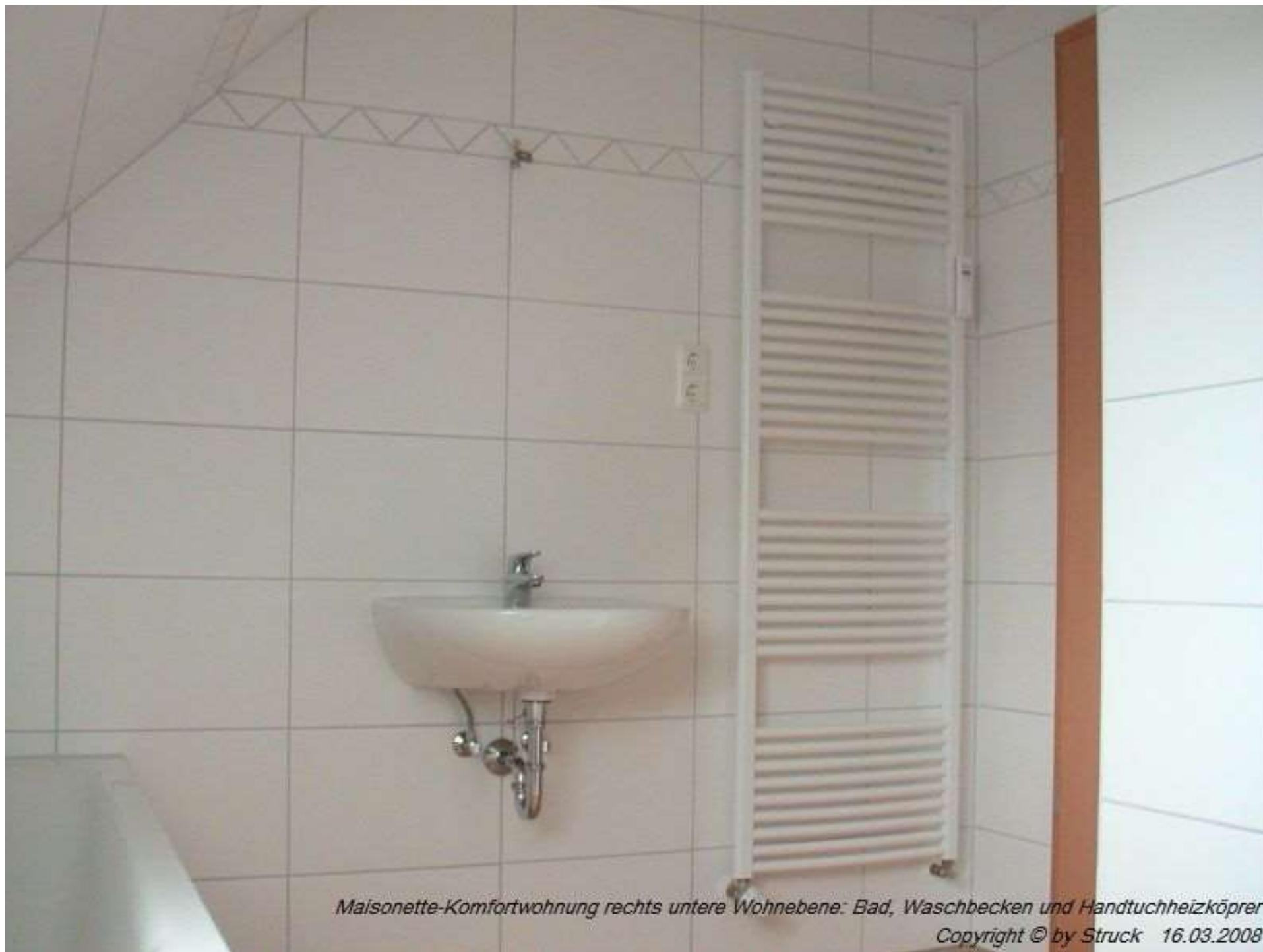
Maisonette-Komfortwohnung rechts untere Wohnebene: Bad, Waschbecken und Handtuchheizkörper