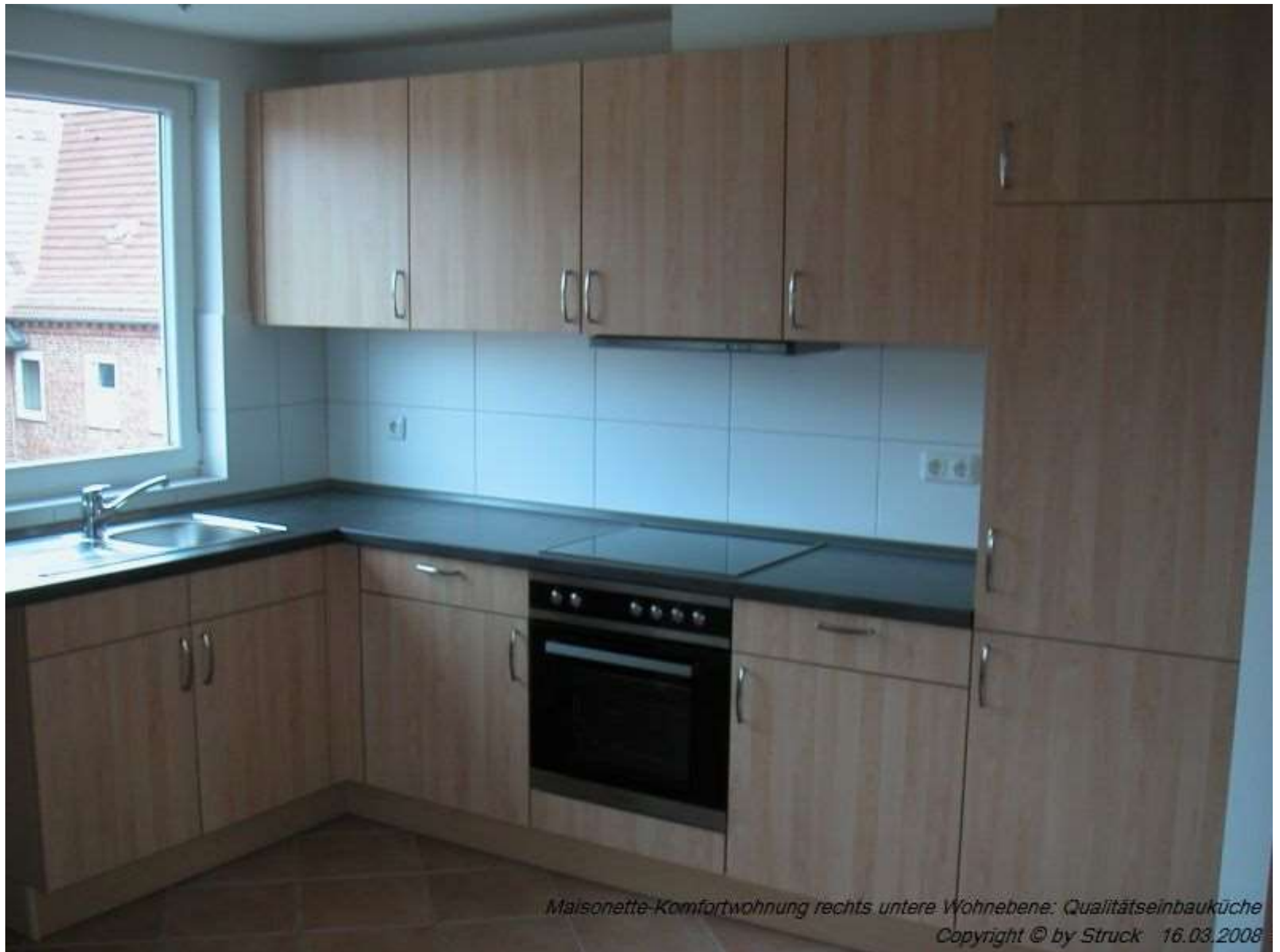
Maisonette-Komfortwohnung rechts untere Wohnebene: Qualitätseinbauküche