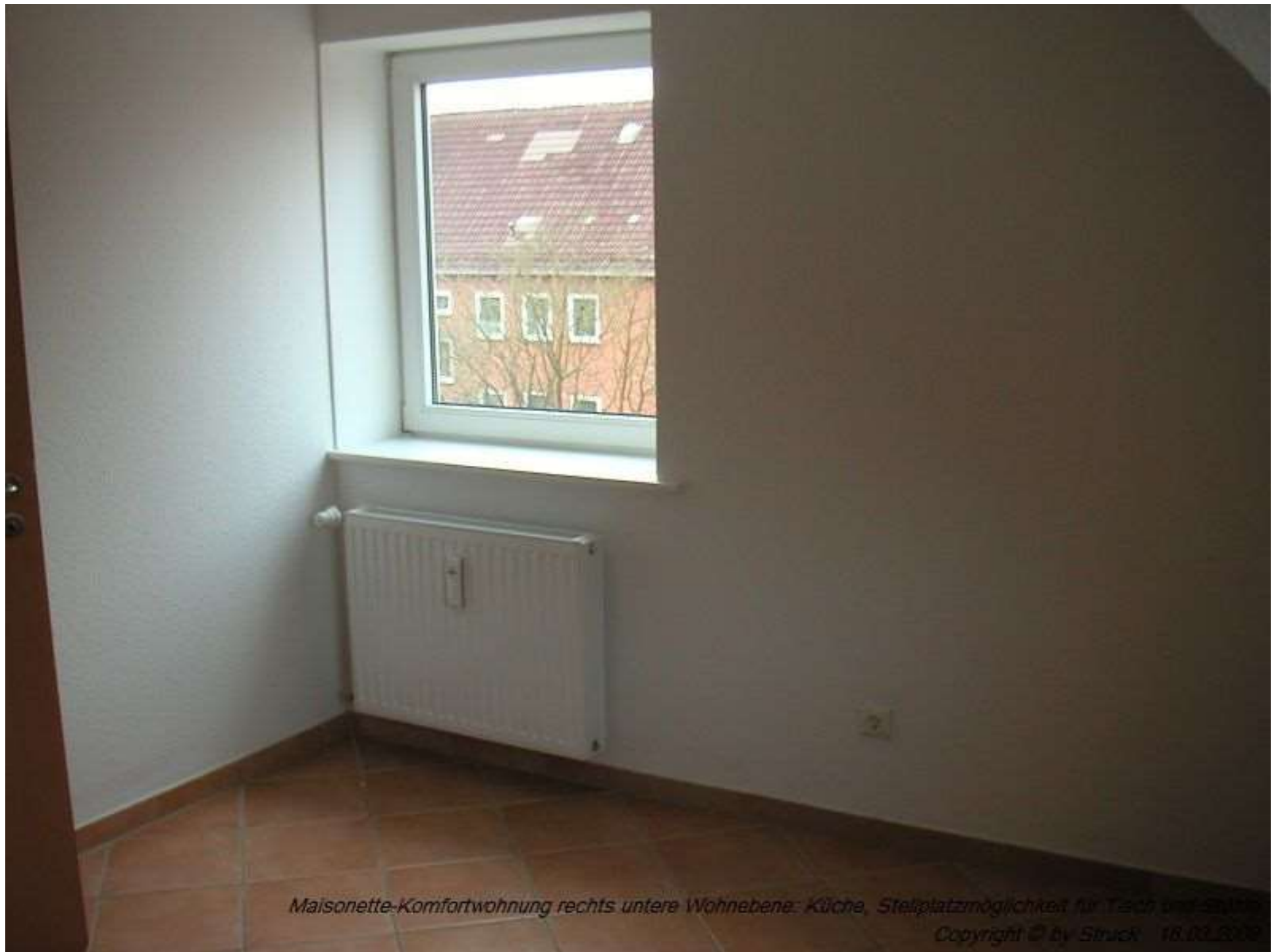
Maisonette-Komfortwohnung rechts untere Wohnebene: Küche, Stelplatzmöglichkeit für Tisch und Stühle