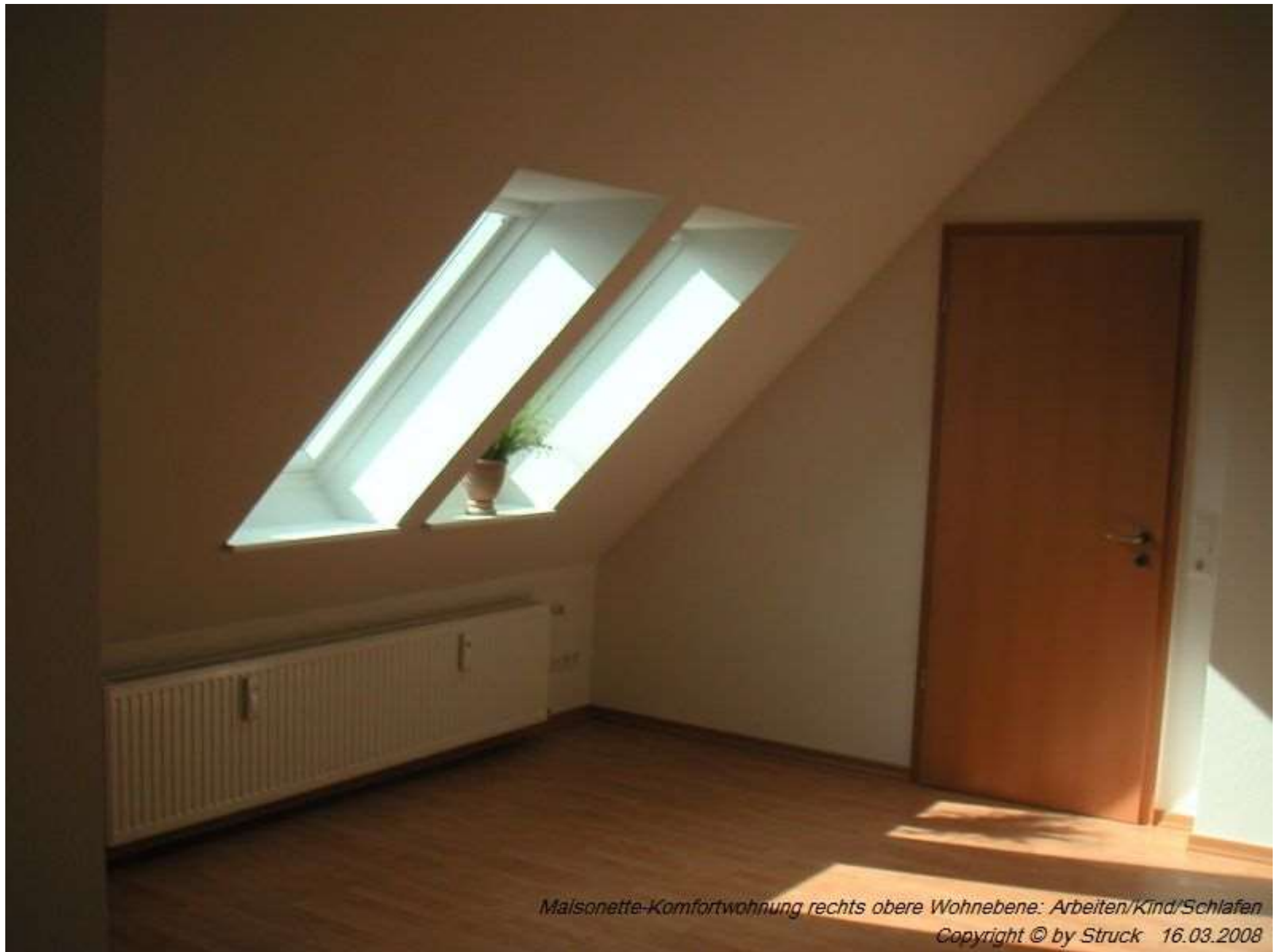
Maisonette-Komfortwohnung rechts obere Wohnebene: Arbeiten/Kind/Schlafen