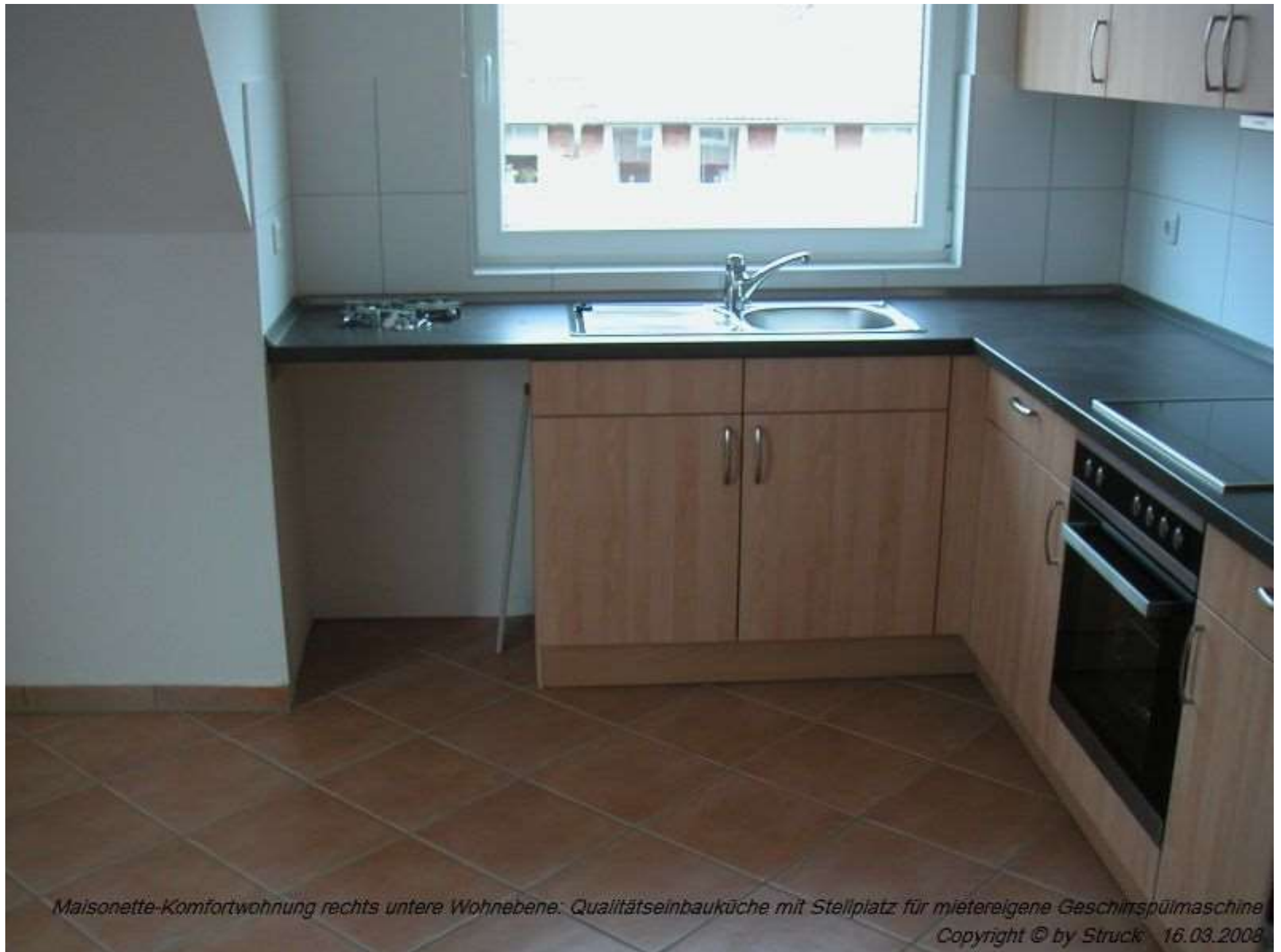
Maisonette-Komfortwohnung rechts untere Wohnebene: Qualitätseinbauküche mit Stellplatz für mietereigene Geschirrspülmaschine