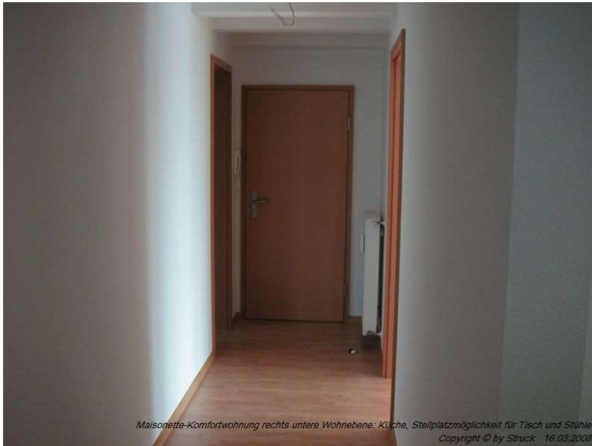
Maisonette-Komfortwohnung rechts untere Wohnebene: Küche, Stellplatzmöglichkeit für Tisch und Stühle