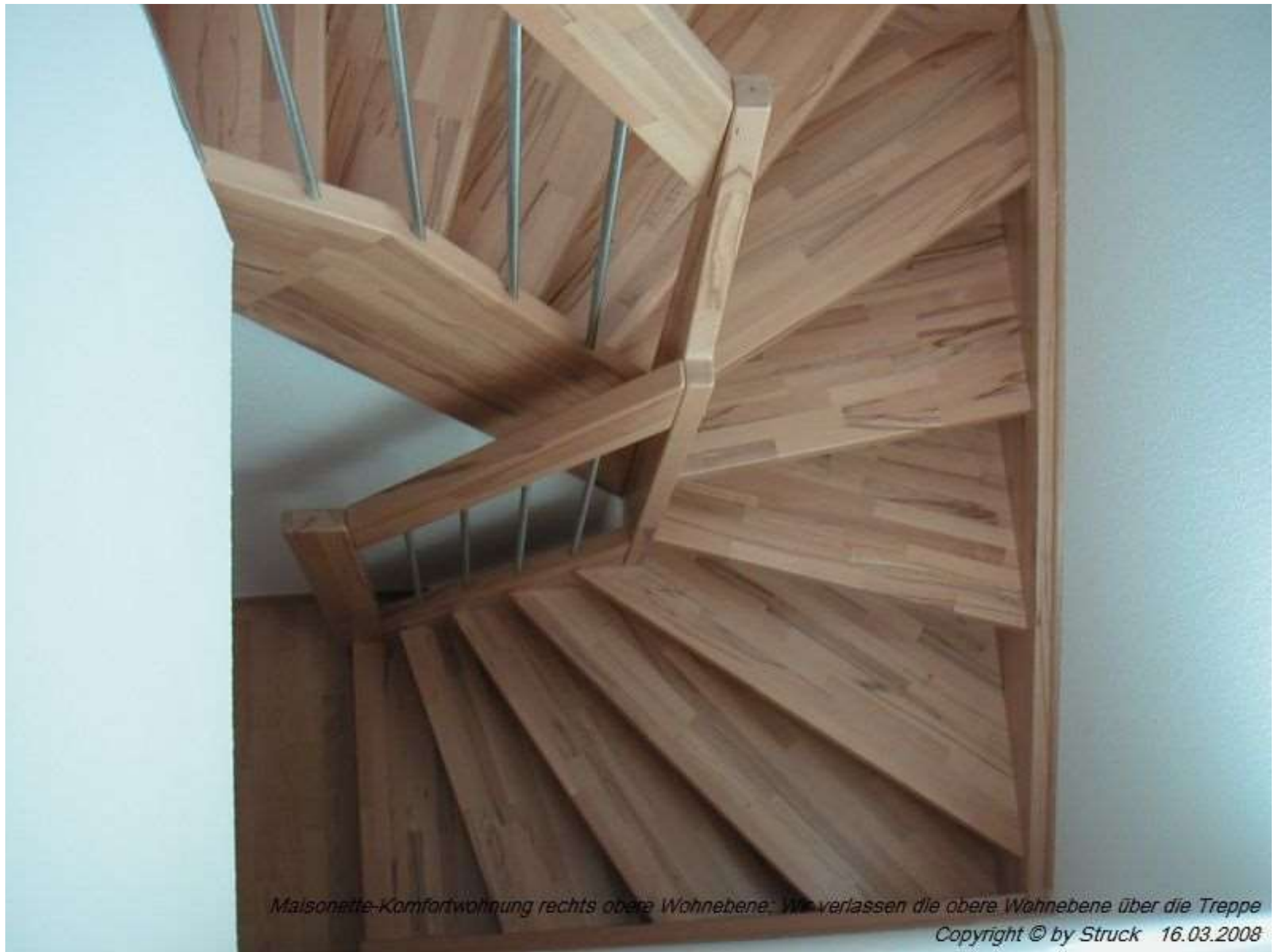
Maisonette-Komfortwohnung rechts obere Wohnebene: Wie verlassen die obere Wohnebene über die Treppe 16.03.2008