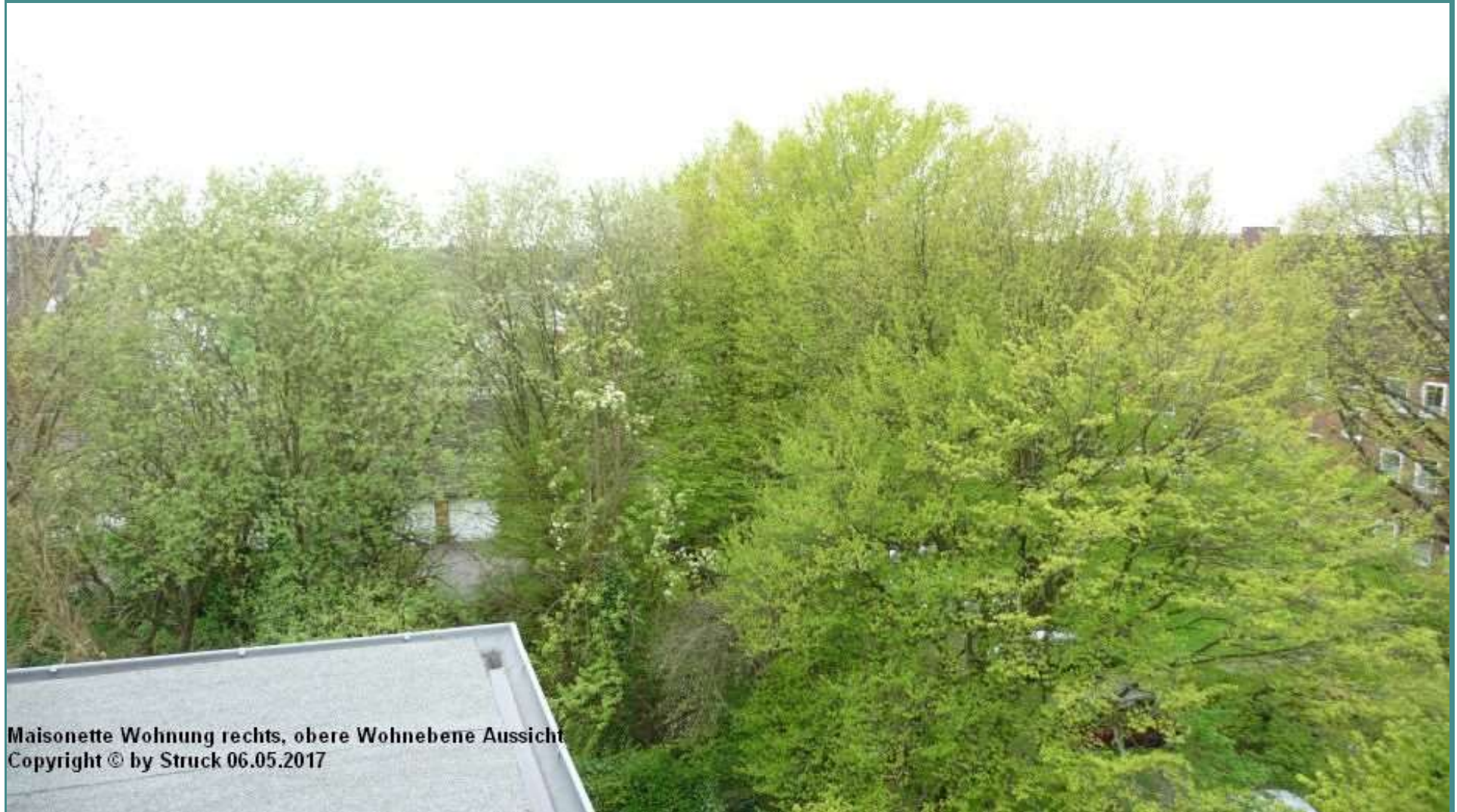
Maisonette Wohnung rechts, obere Wohnebene Aussicht 06.05.2017