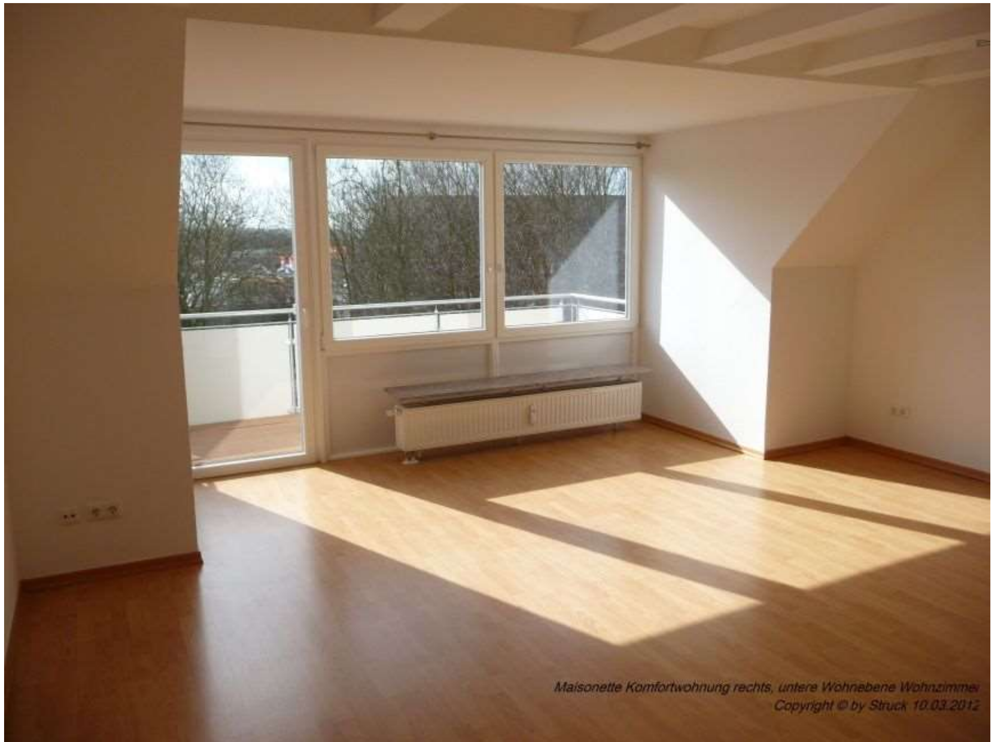
Maisonette Komfortwohnung rechts, untere Wohnabene Wohnzimmer