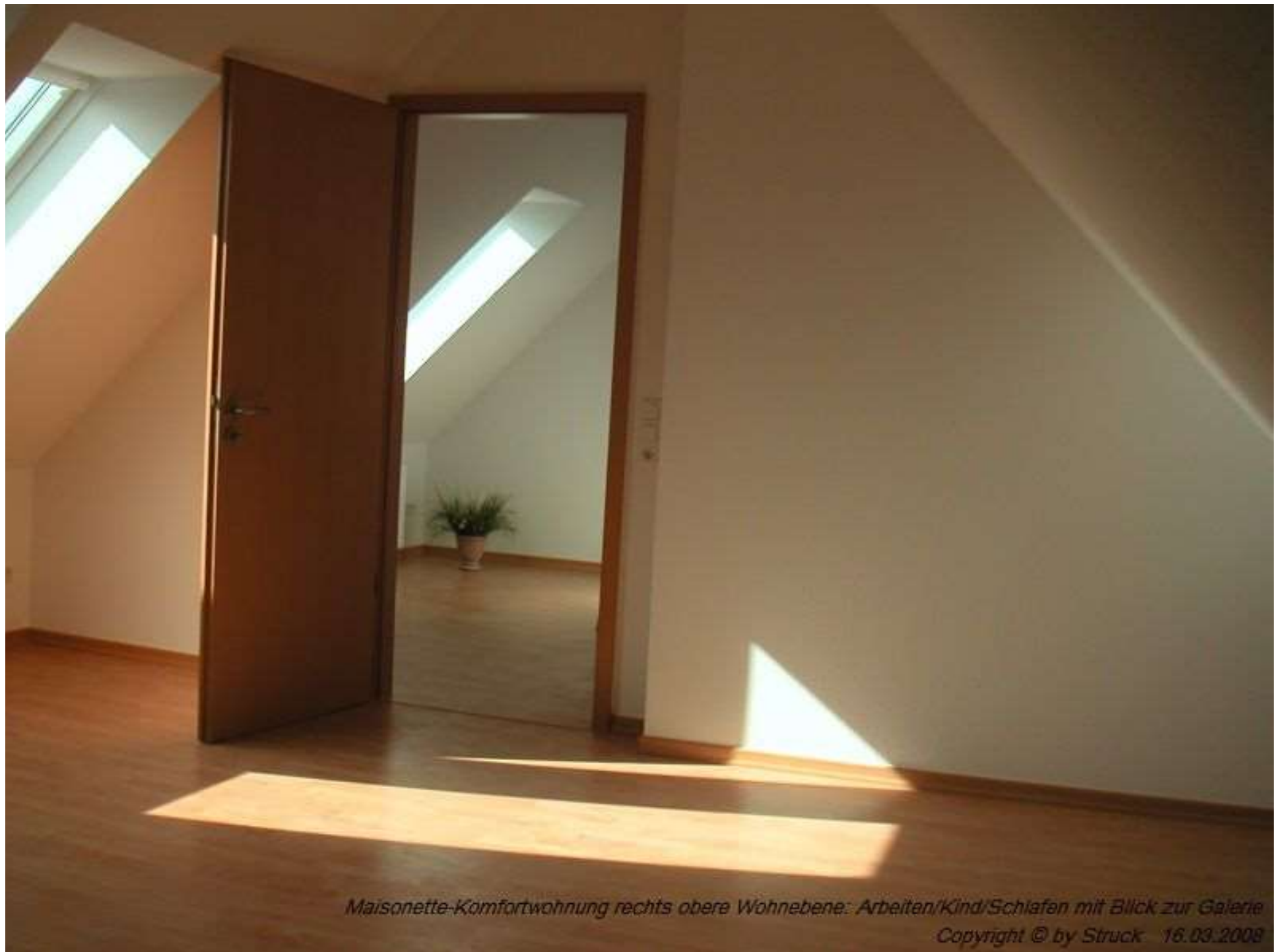
Maisonette-Komfortwohnung rechts obere Wohnebene: Arbeiten/Kind/Schlafen mit Blick zur Galerie 16.03.2008