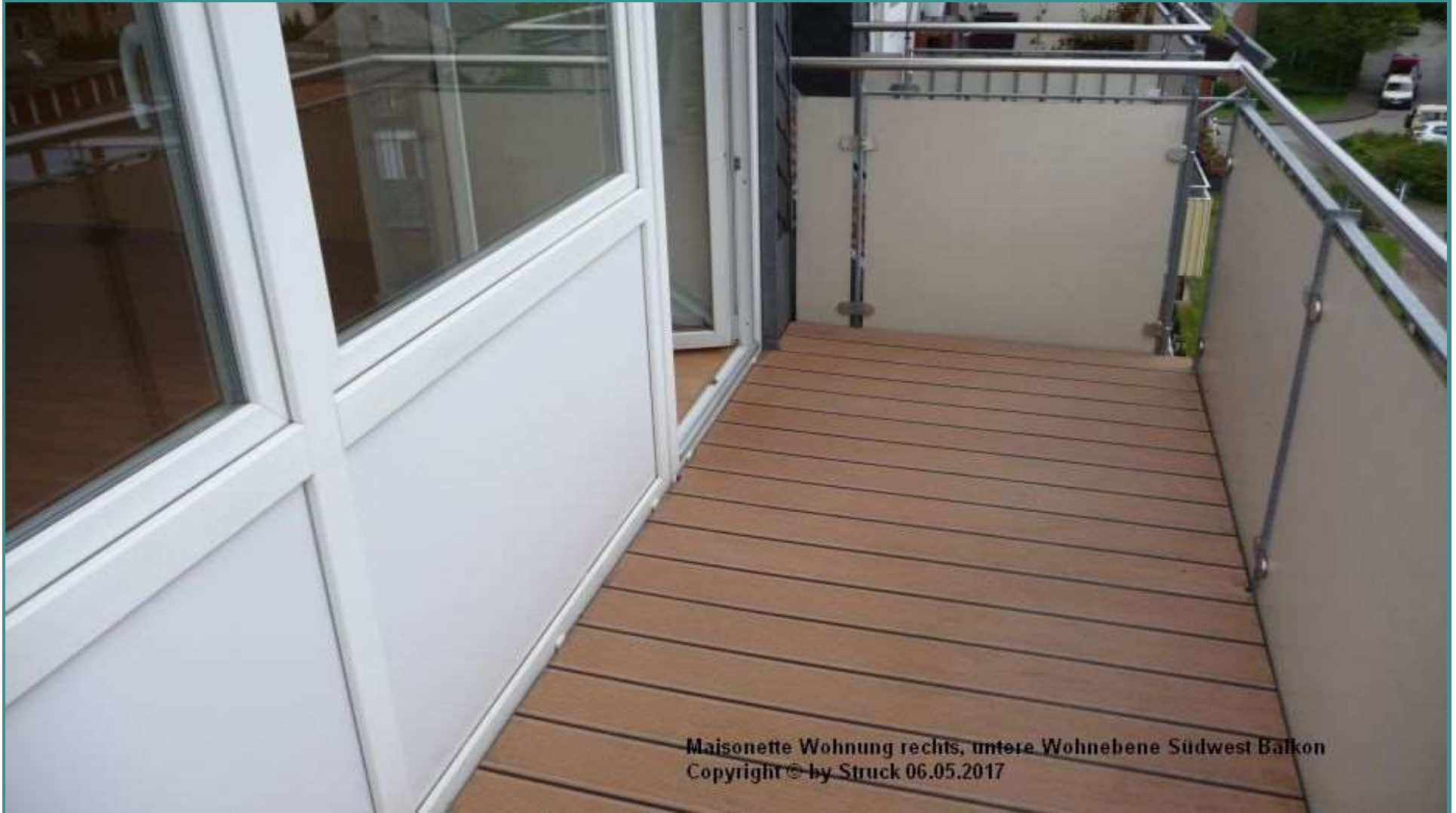
Maisonette Wohnung rechts, untere Wohnebene Südwest Balkon