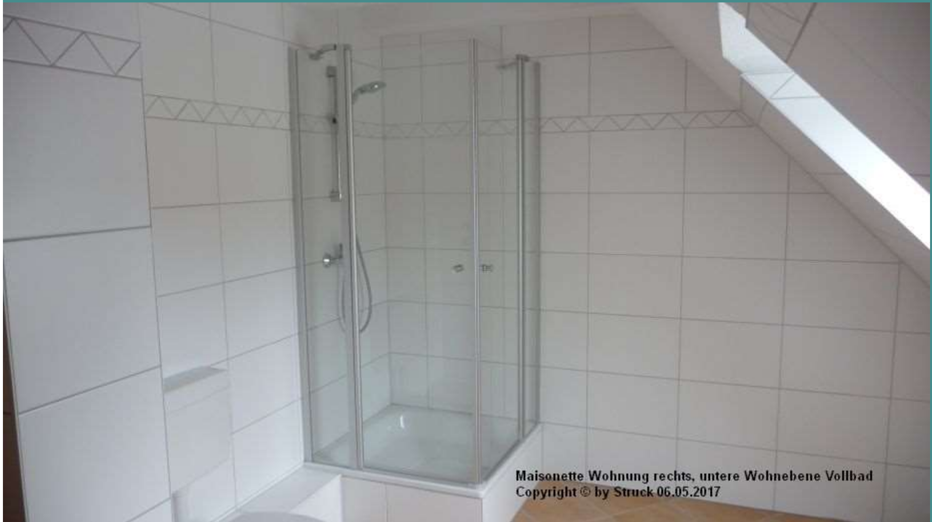
Maisonette Wohnung rechts, untere Wohnebene Vollbad