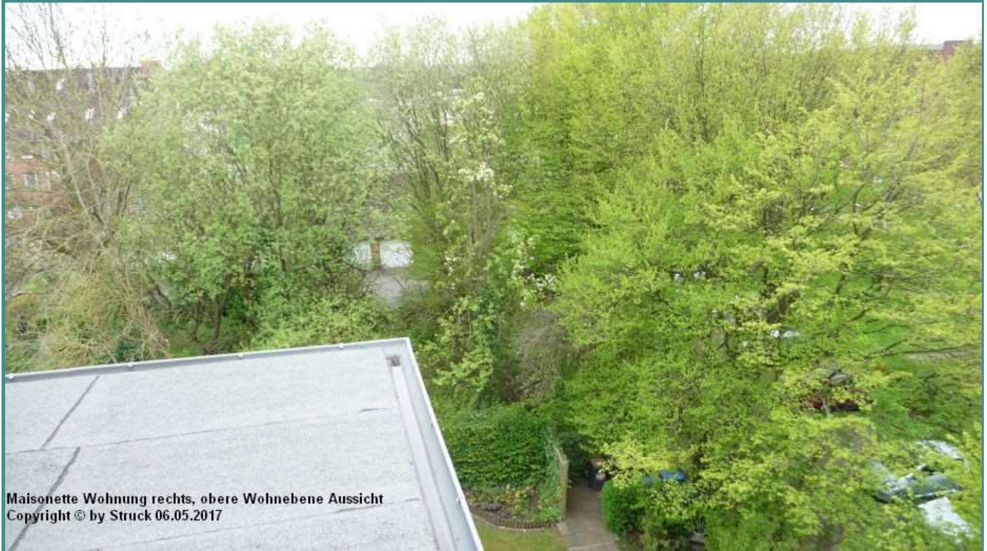
Maisonette Wohnung rechts, obere Wohnebene Aussicht