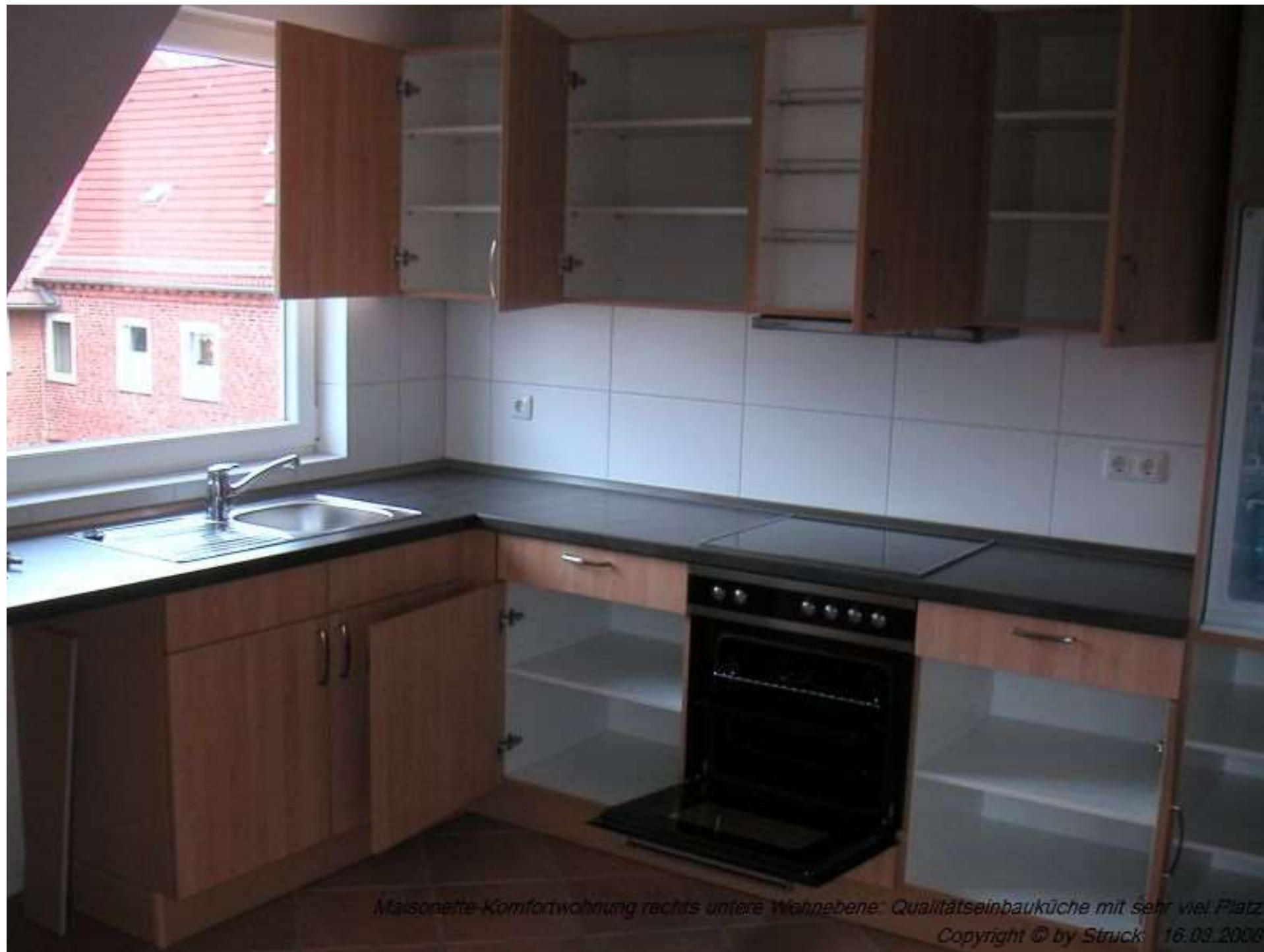
Maisonette-Komfortwohnung rechts untere Wannebene: Qualitätseinbauküche mit sehr viel Platz. 16.09.2008