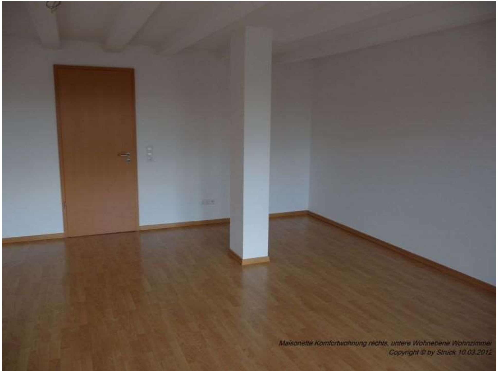
Maisonette Komfortwohnung rechts, untere Wohnebene Wohnzimmer