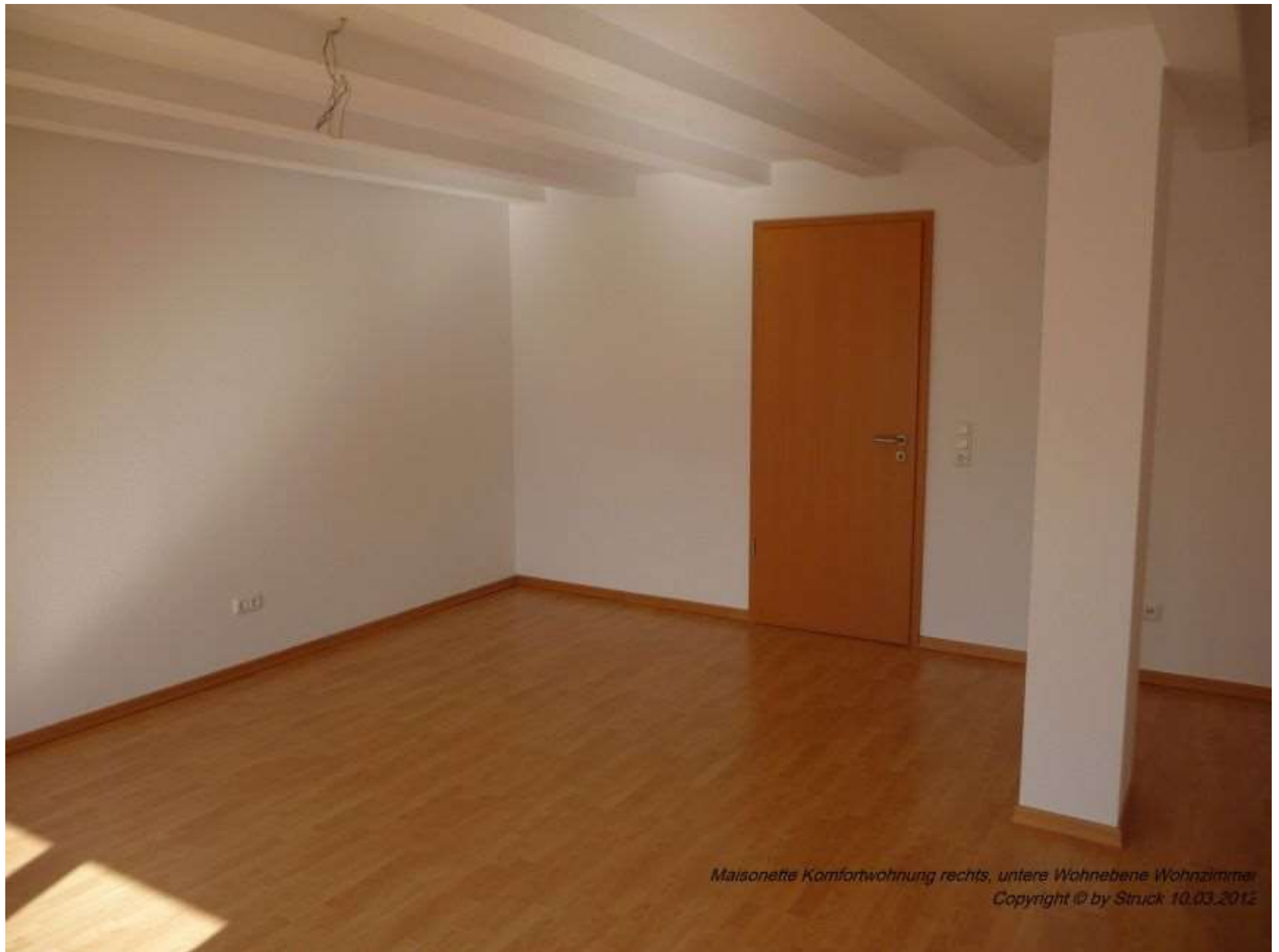
Maisonette Komfortwohnung rechts, untere Wohnebene Wohnzimmer