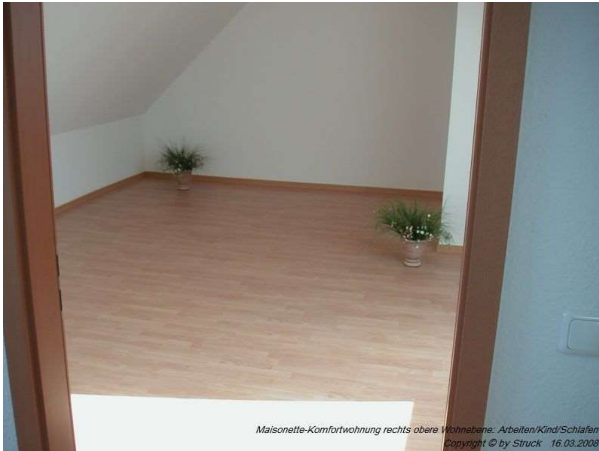
Maisonette-Komfortwohnung rechts obere Wohnebene: Arbeiten/Kind/Schlafen