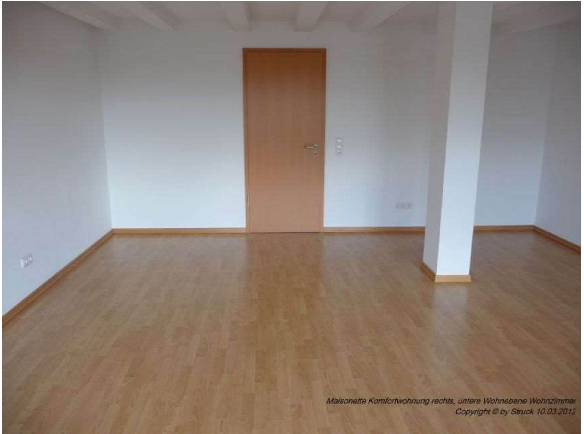
Maisonette Komfortwohnung rechts, untere Wohnebene Wohnzimmer