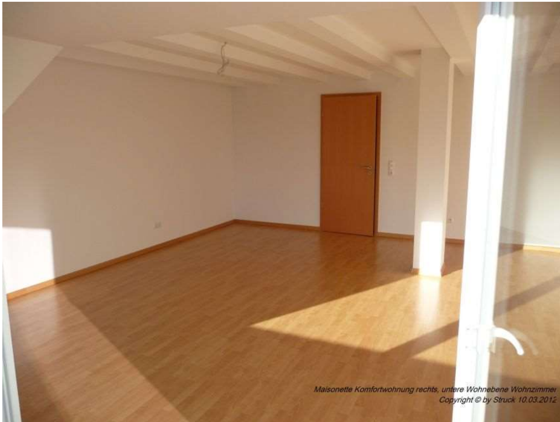
Maisonette Komfortwohnung rechts, untere Wohnebene Wohnzimmer