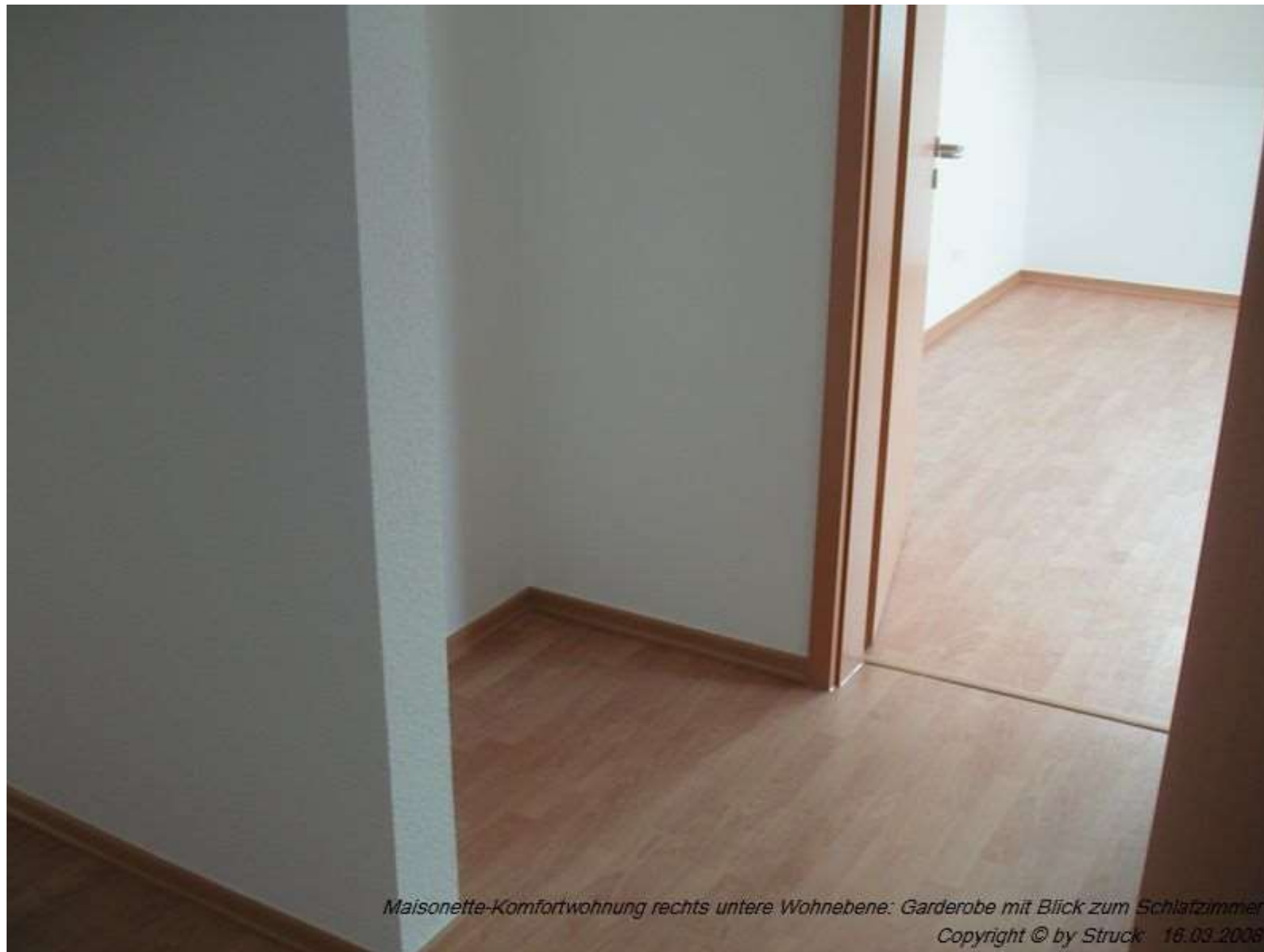
Maisonette-Komfortwohnung rechts untere Wohnebene: Garderobe mit Blick zum Schlafzimmer