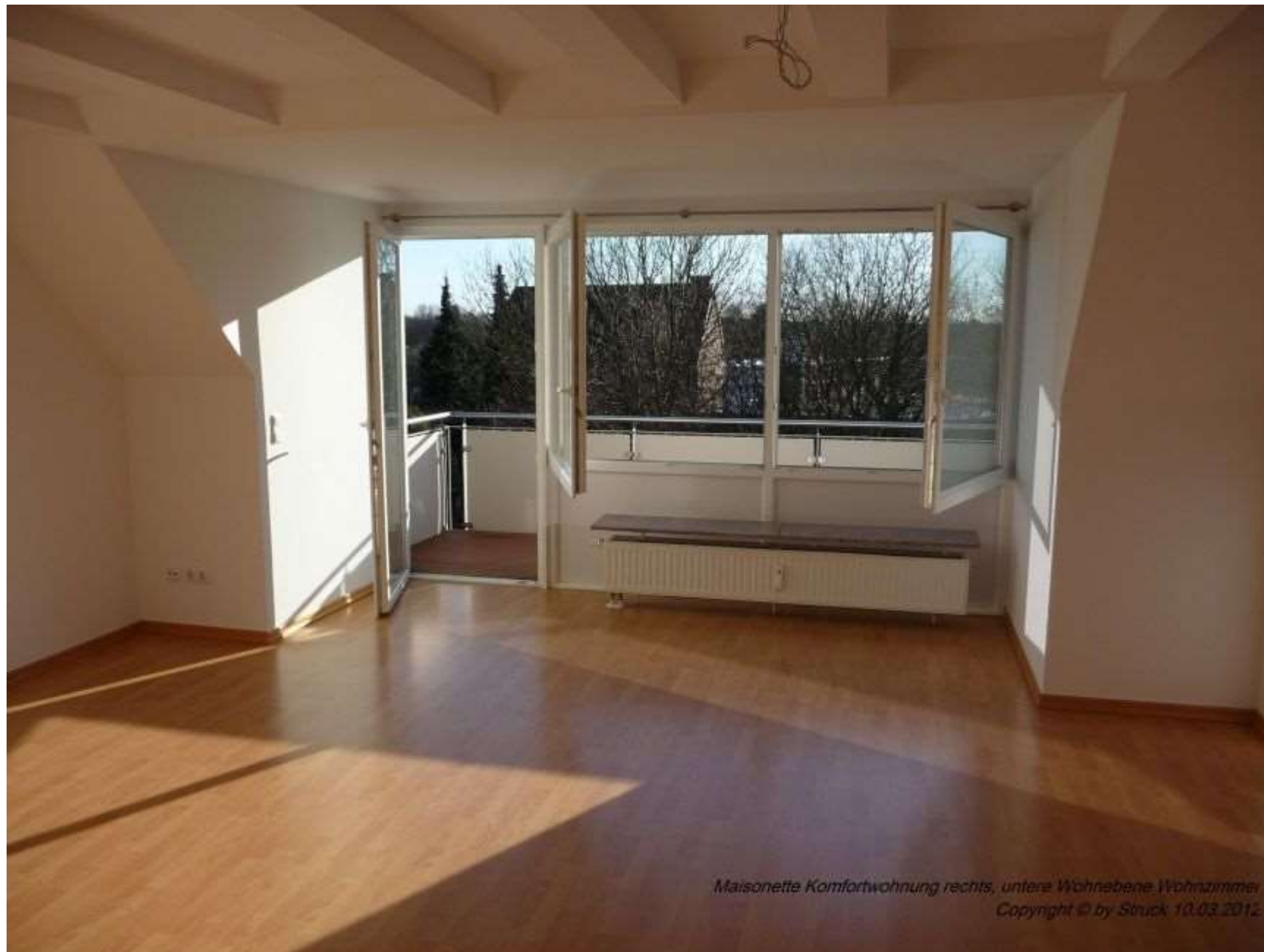
Maisonette Komfortwohnung rechts, untere Wohnebene Wohnzimmer 10.03.2012