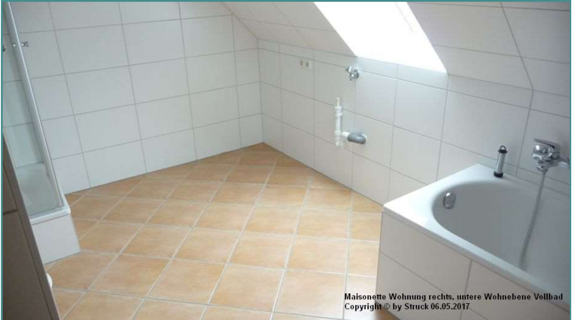
Maisonette Wohnung rechts, untere Wohnebene Vollbad