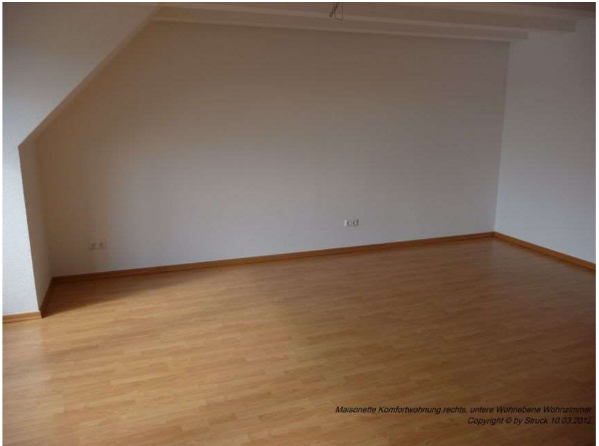
Maisonette Komfortwohnung rechts, untere Wohnebene Wohnzimmer