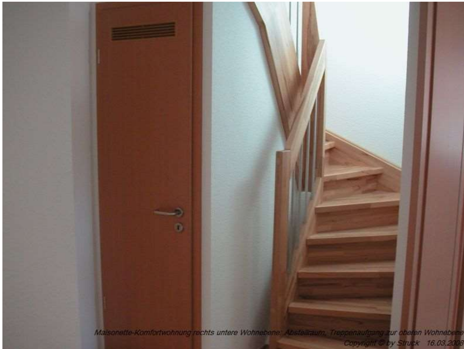
Maisonette-Komfortwohnung rechts untere Wohnebene: Abstellraum, Treppenaufgang zur oberen Wohnebene