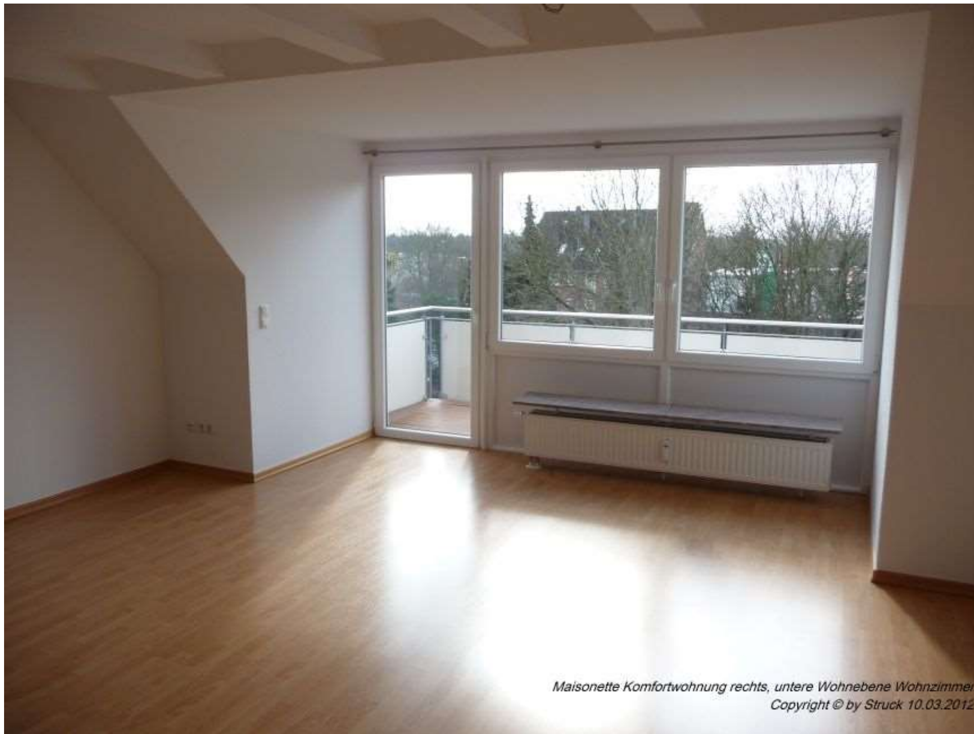
Maisonette Komfortwohnung rechts, untere Wohnebene Wohnzimmer