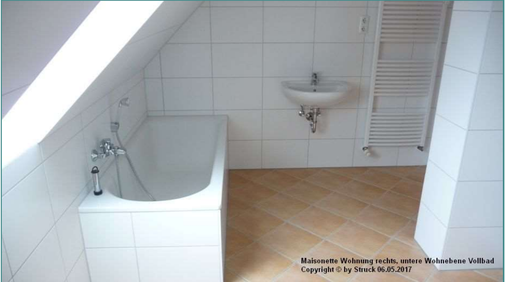
Maisonette Wohnung rechts, untere Wohnebene Vollbad 06.05.2017