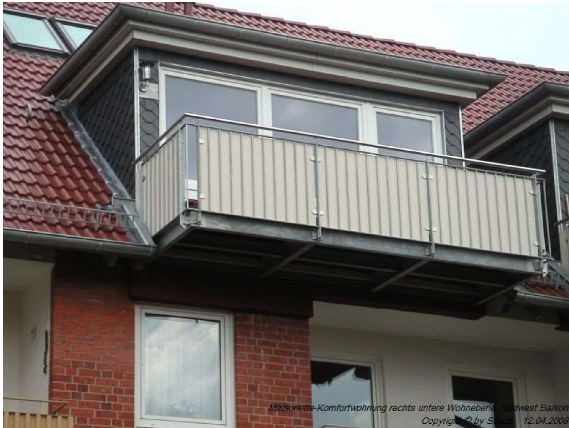
Maisonette-Komfortwohnung rechts untere Wohnebene Südwest Balkon 12.04.2008