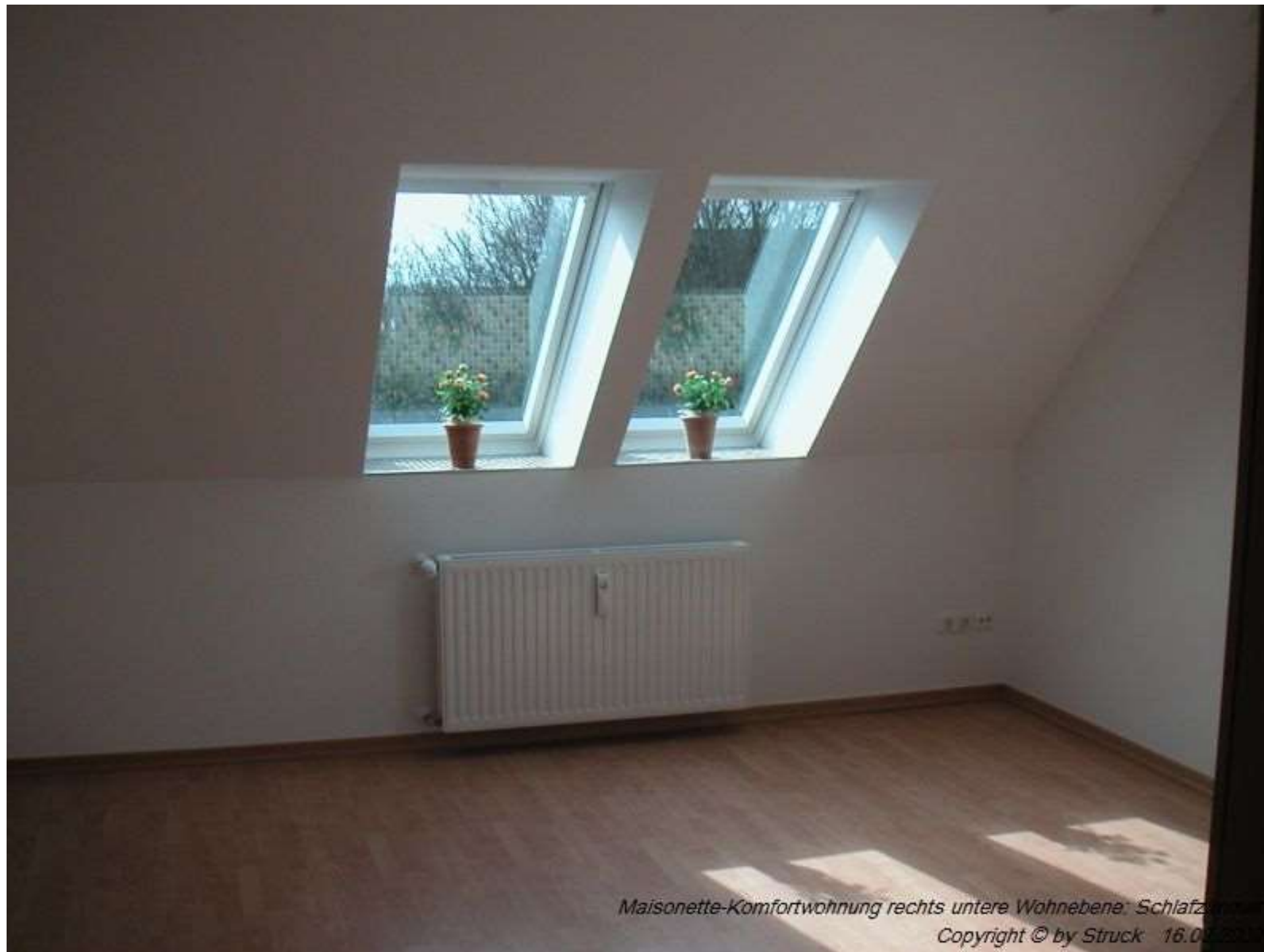
Maisonette-Komfortwohnung rechts untere Wohnebene: Schlafzimmer