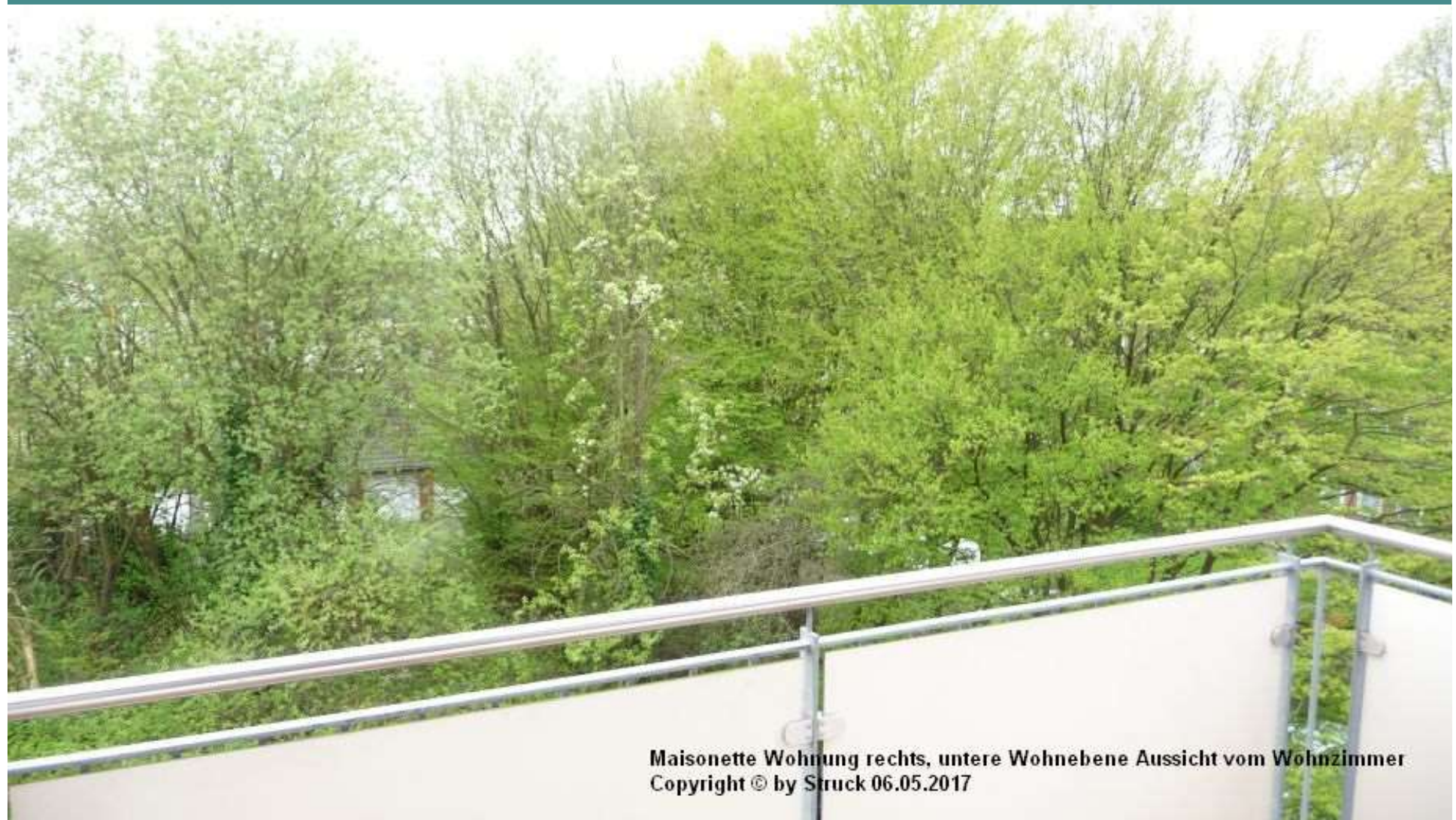
Maisonette Wohnung rechts, untere Wohnebene Aussicht vom Wohnzimmer