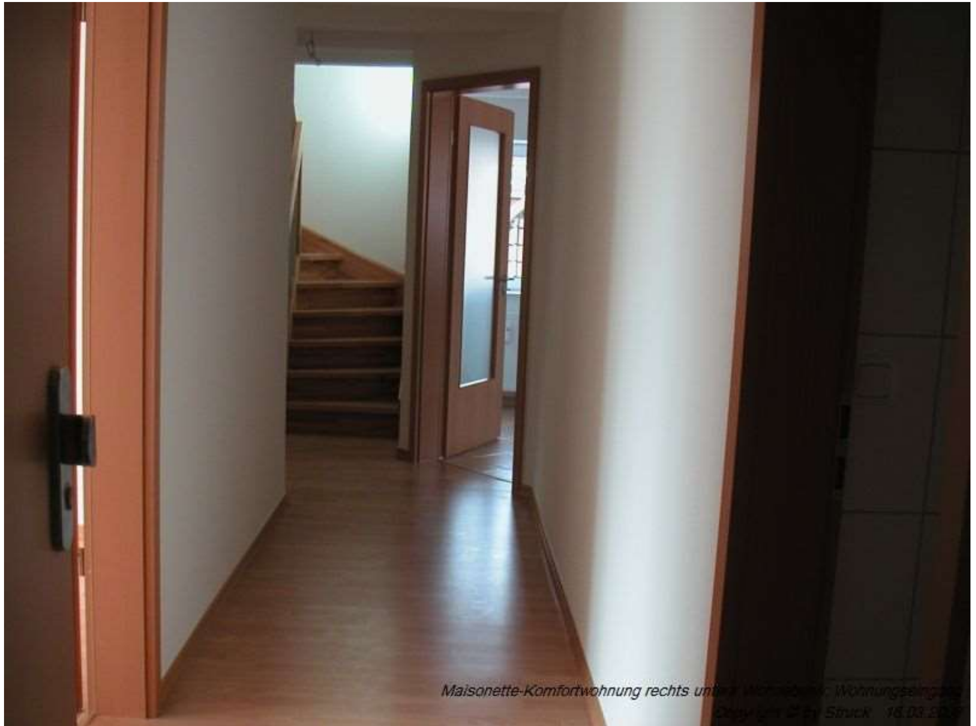
Maisonette-Komfortwohnung rechts unten, Wohnbereich, Wohnungsingang