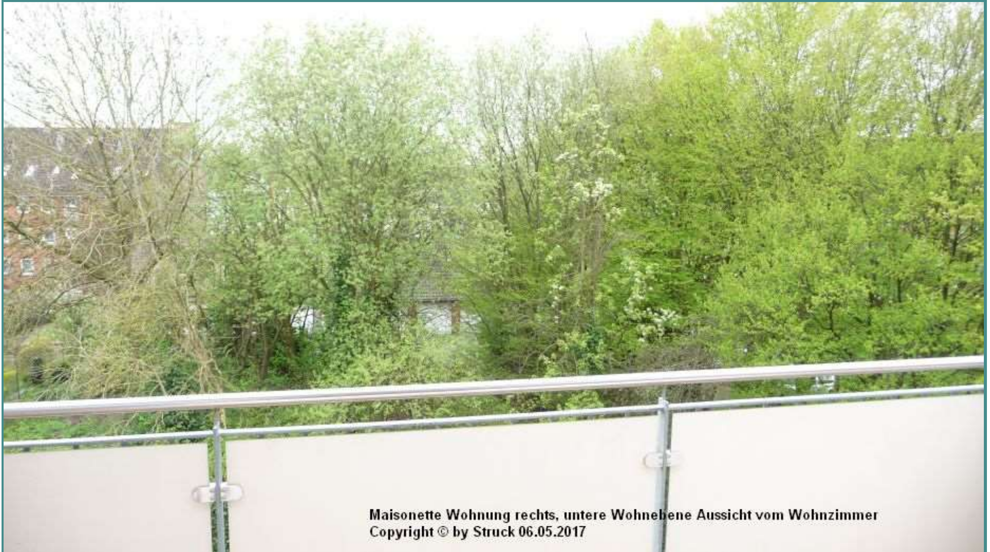
Maisonette Wohnung rechts, untere Wohnebene Aussicht vom Wohnzimmer