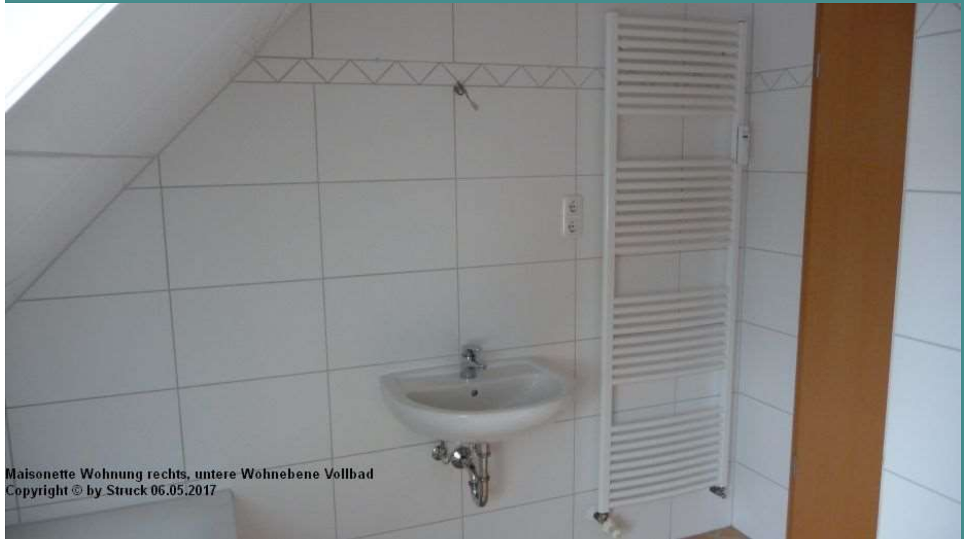
Maisonette Wohnung rechts, untere Wohnebene Vollbad