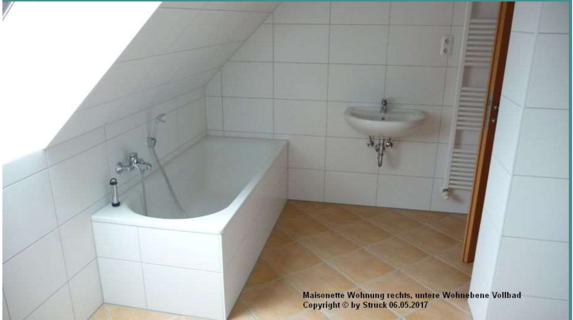
Maisonette Wohnung rechts, untere Wohnebene Vollbad 06.05.2017