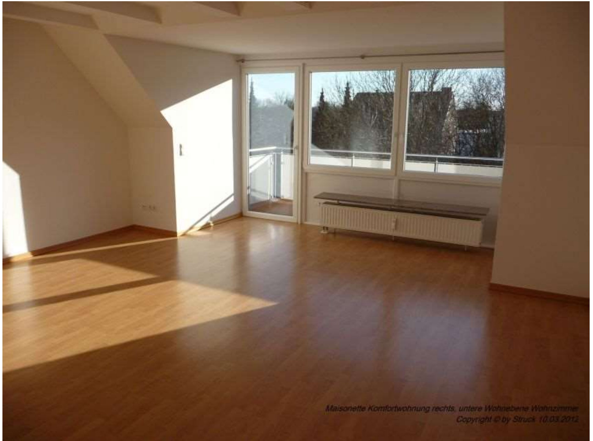
Maisonette Komfortwohnung rechts, untere Wohnebene Wohnzimmer