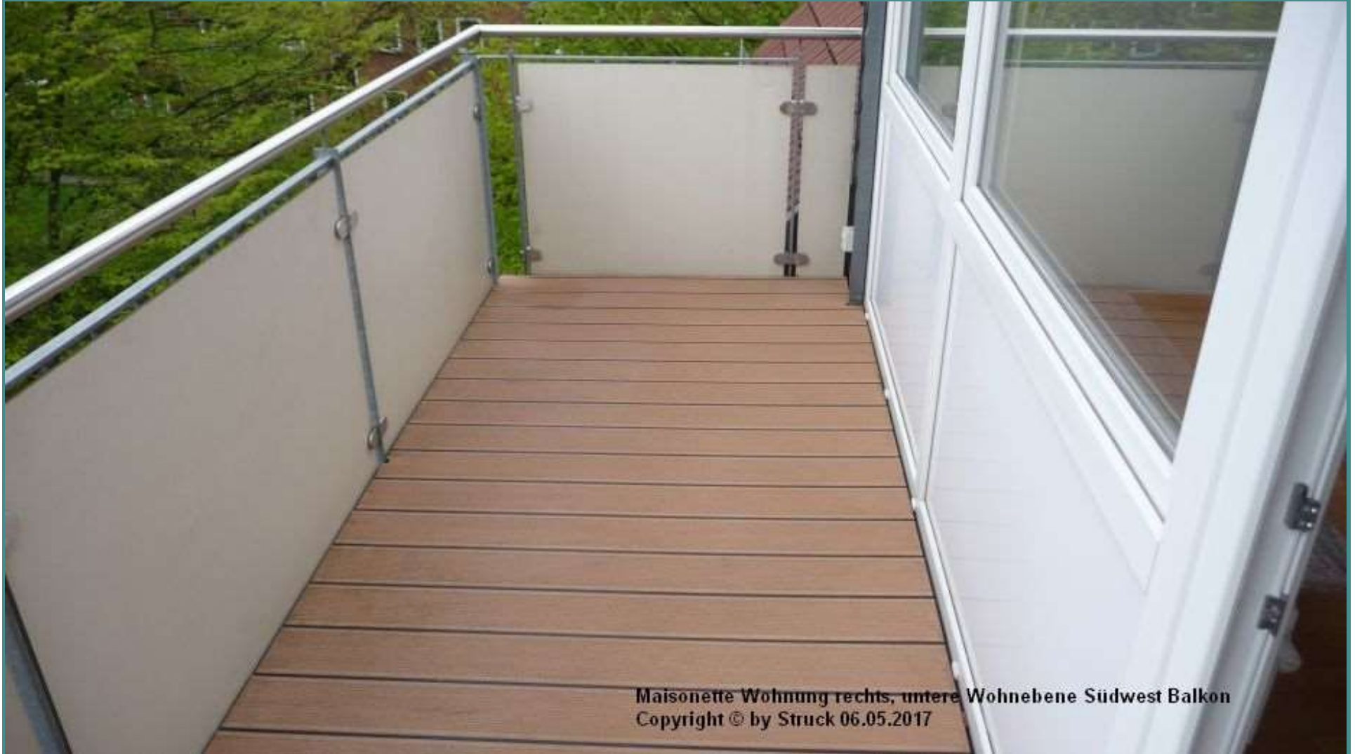
Maisonette Wohnung rechts, untere Wohnebene Südwest Balkon