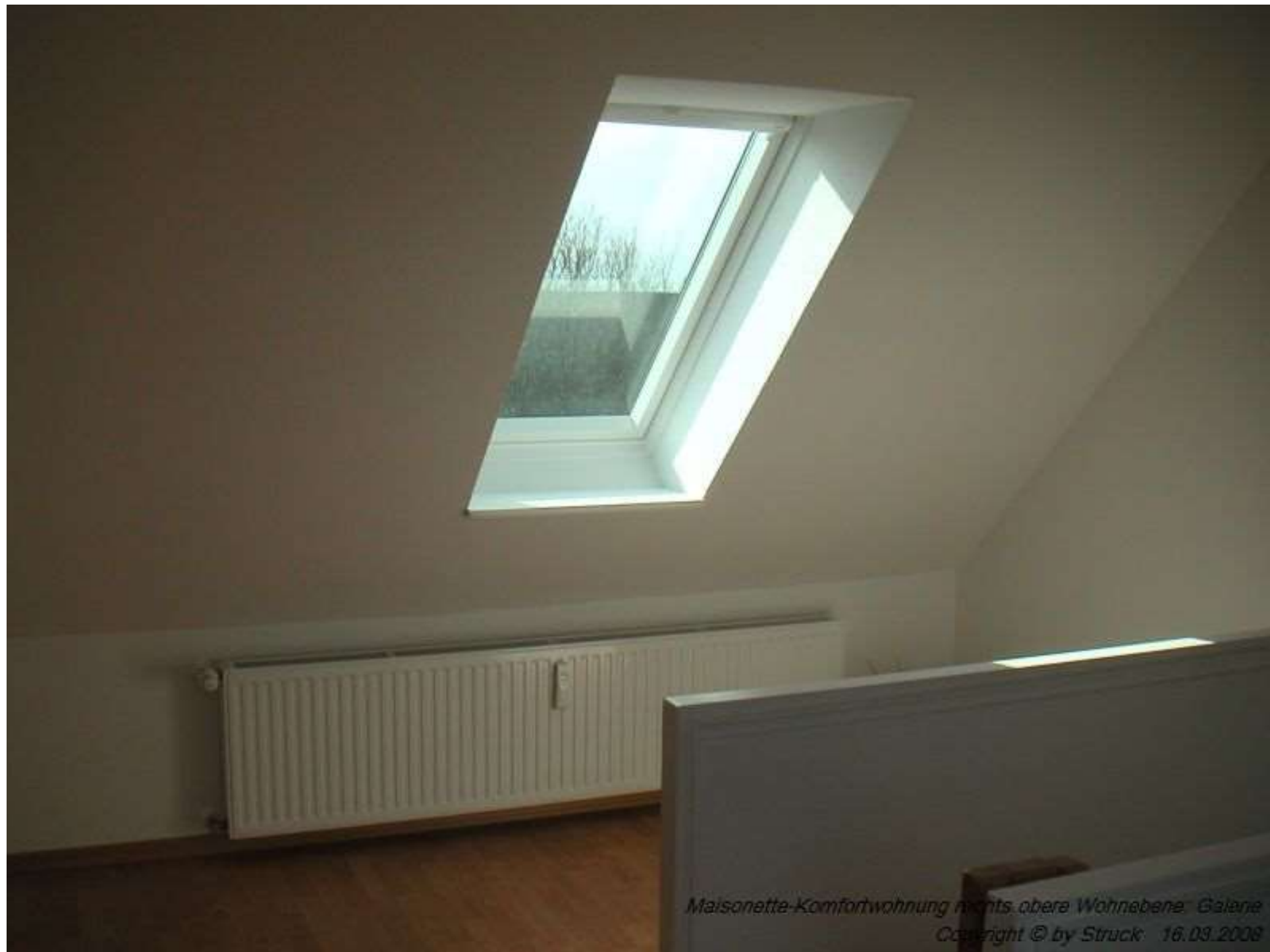
Maisonette-Komfortwohnung rechts obere Wohnebene Galerie