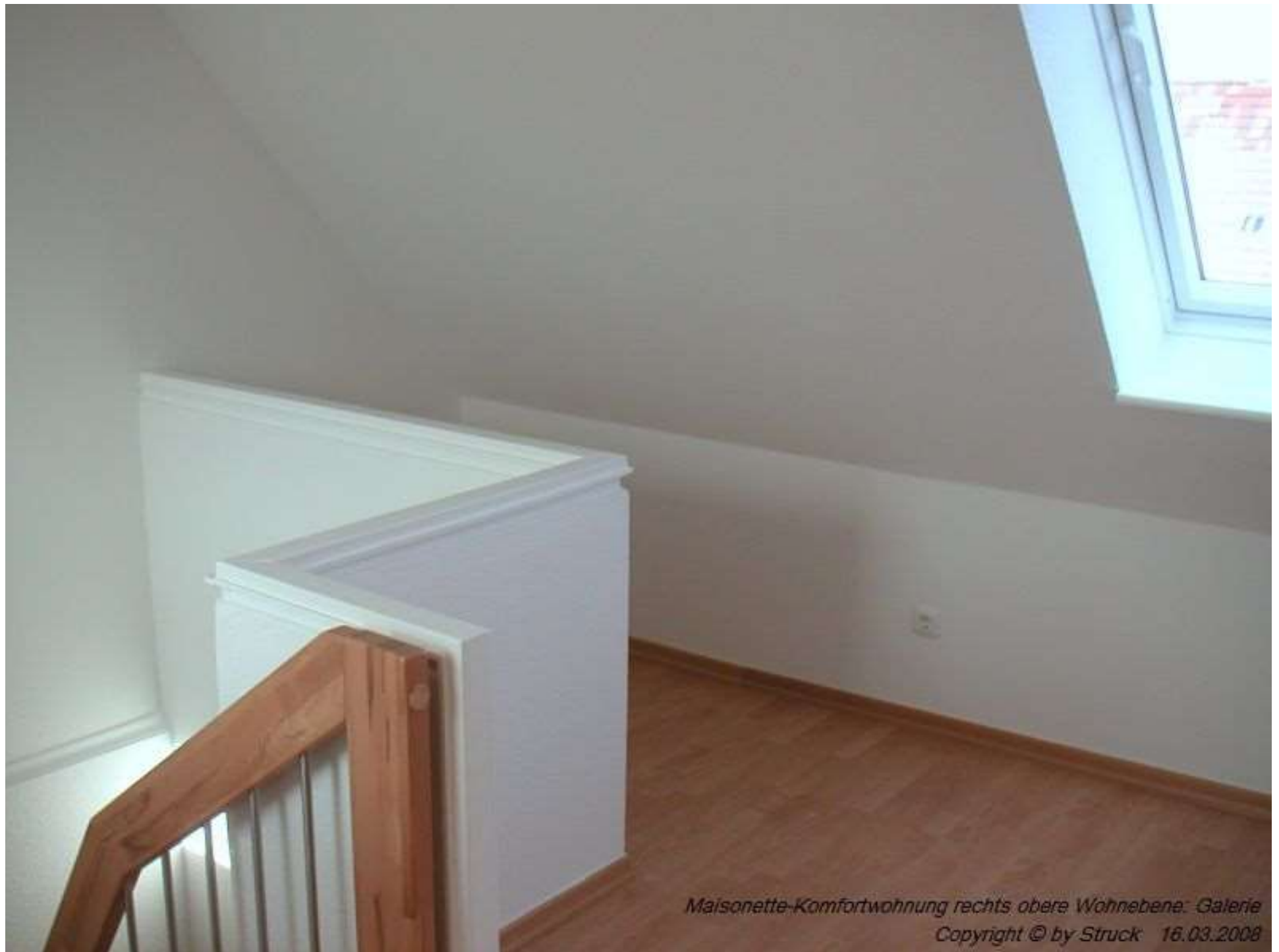
Maisonette-Komfortwohnung rechts obere Wohnebene: Galerie 16.03.2008