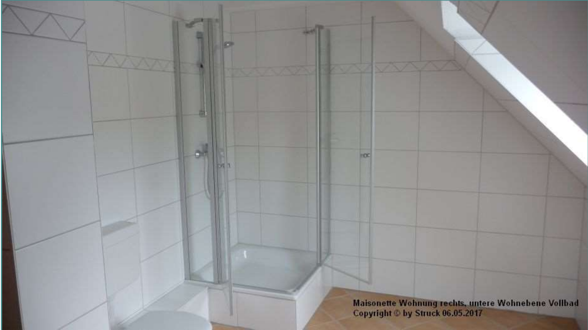
Maisonette Wohnung rechts, untere Wohnebene Vollbad