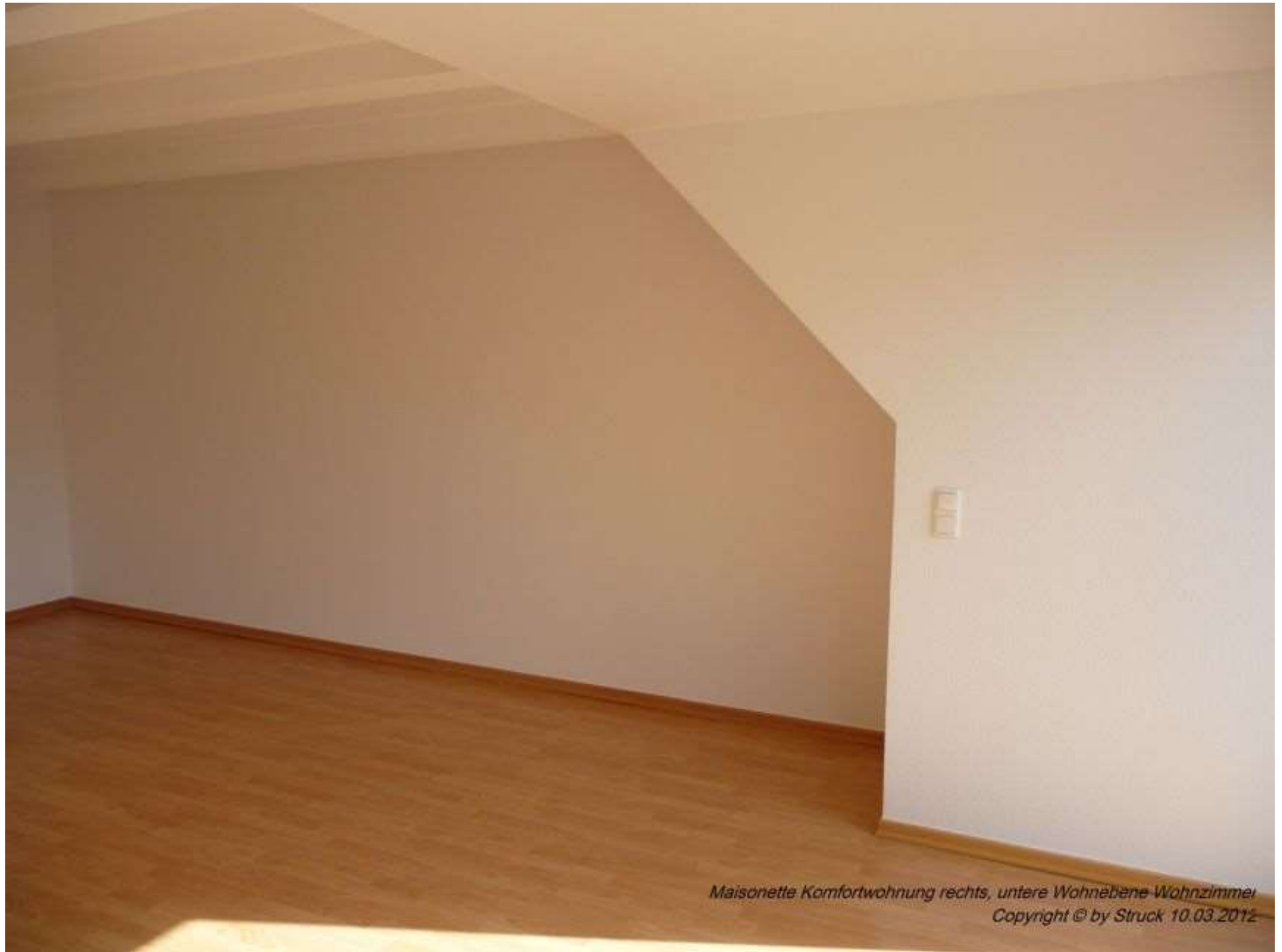
Maisonette Komfortwohnung rechts, untere Wohnebene Wohnzimmer