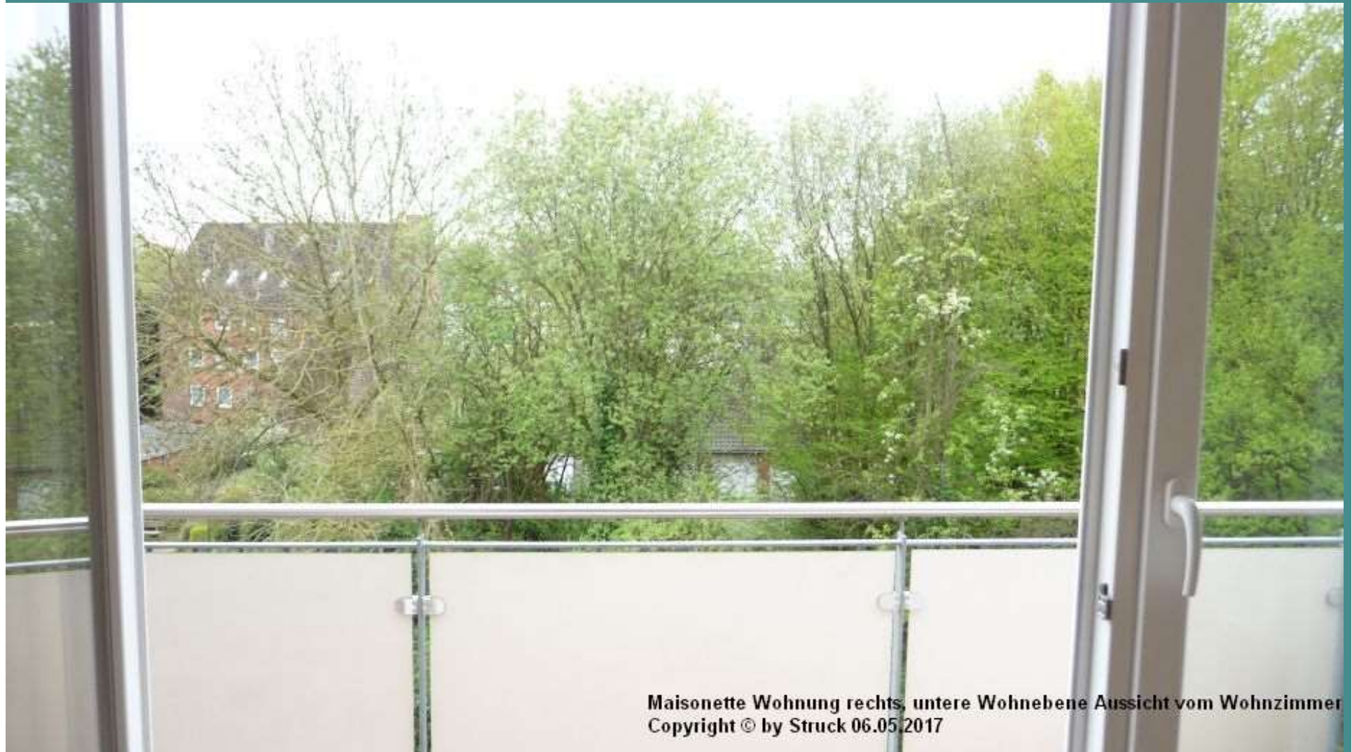
Maisonette Wohnung rechts, untere Wohnebene Aussicht vom Wohnzimmer 06.05.2017